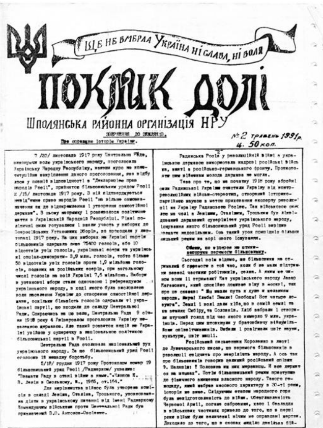
Газета Шполянської районної організації НРУ 1991 р.