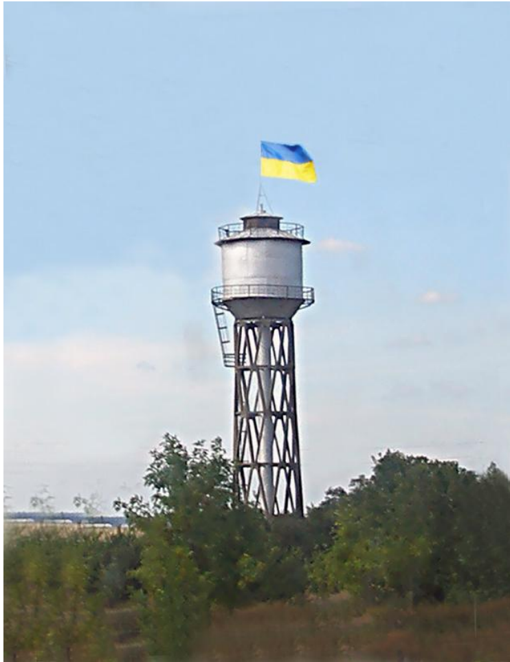
Синьо-жовтий “вибух” над водонапірною вежею. м. Шпола, 5 квітня 1990 рік.