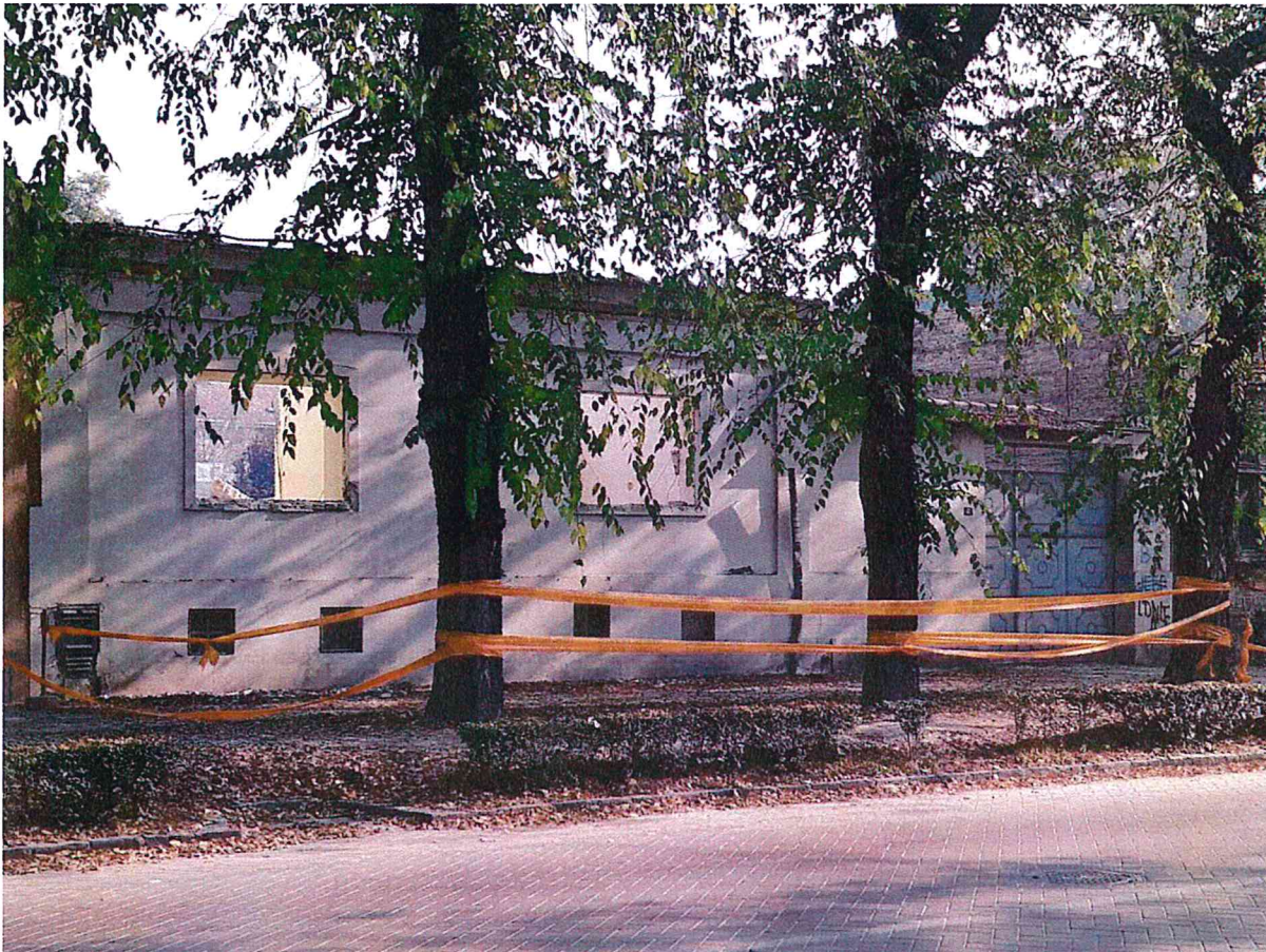
Објекат под бројем 41 који се руши у оквиру ПКИЦ Улица Браће Радић у Суботици (28.10.2019)