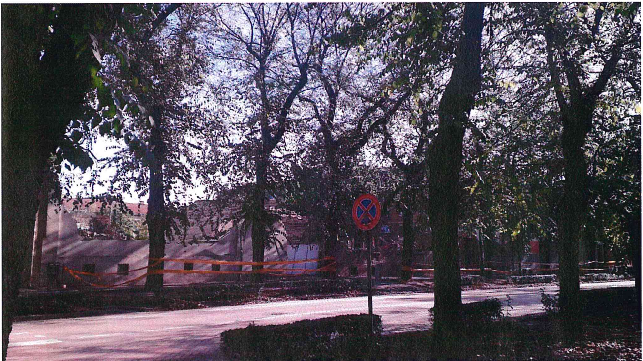
Објекти под бројевима 41-45 који се руши у оквиру ПКИЦ Улица Браће Радић у Суботици (31.10.2019)