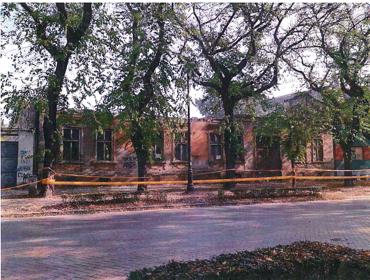
Објекат под бројем 43 који се руши у оквиру ПКИЦ Улица Браће Радић у Суботици (28.10.2019)