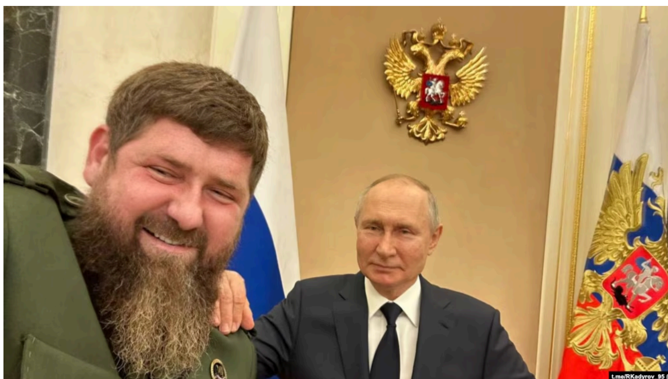
Рамзан Кадыров и Владимир Путин. Архивное фото

Сооснователь "Новой газеты" и лауреат Нобелевской премии мира Дмитрий Муратов обратился в правоохранительные органы с заявлениями о проверке высказываний главы Чечни Рамзана Кадырова, зампреда Совета безопасности России Дмитрия Медведева и других чиновников, которые призывали к ядерному удару в ходе войны против Украины.