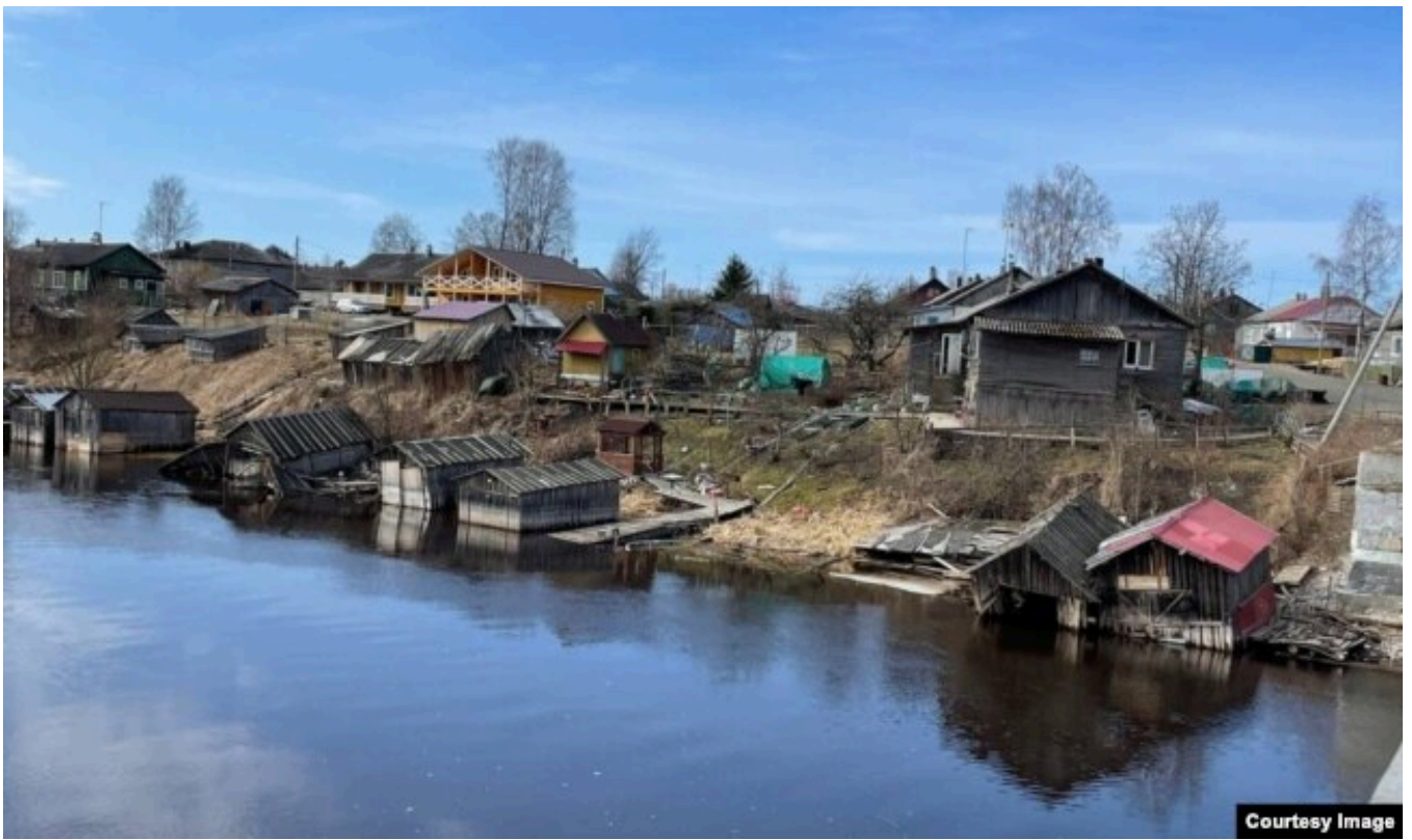
Деревня Хийденсельга - центр карельского туризма

В 2025 году доходы региона от туризма составили 574 миллиона рублей – на 20% больше, чем годом ранее, – отчитываются карельские чиновники. Местных жителей, однако, такое бурное развитие туризма не радует. Они уверены, что это наносит непоправимый вред хрупкой северной природе. И говорят о том, что приток туристов только усиливает "вопиющую разруху" в регионе.