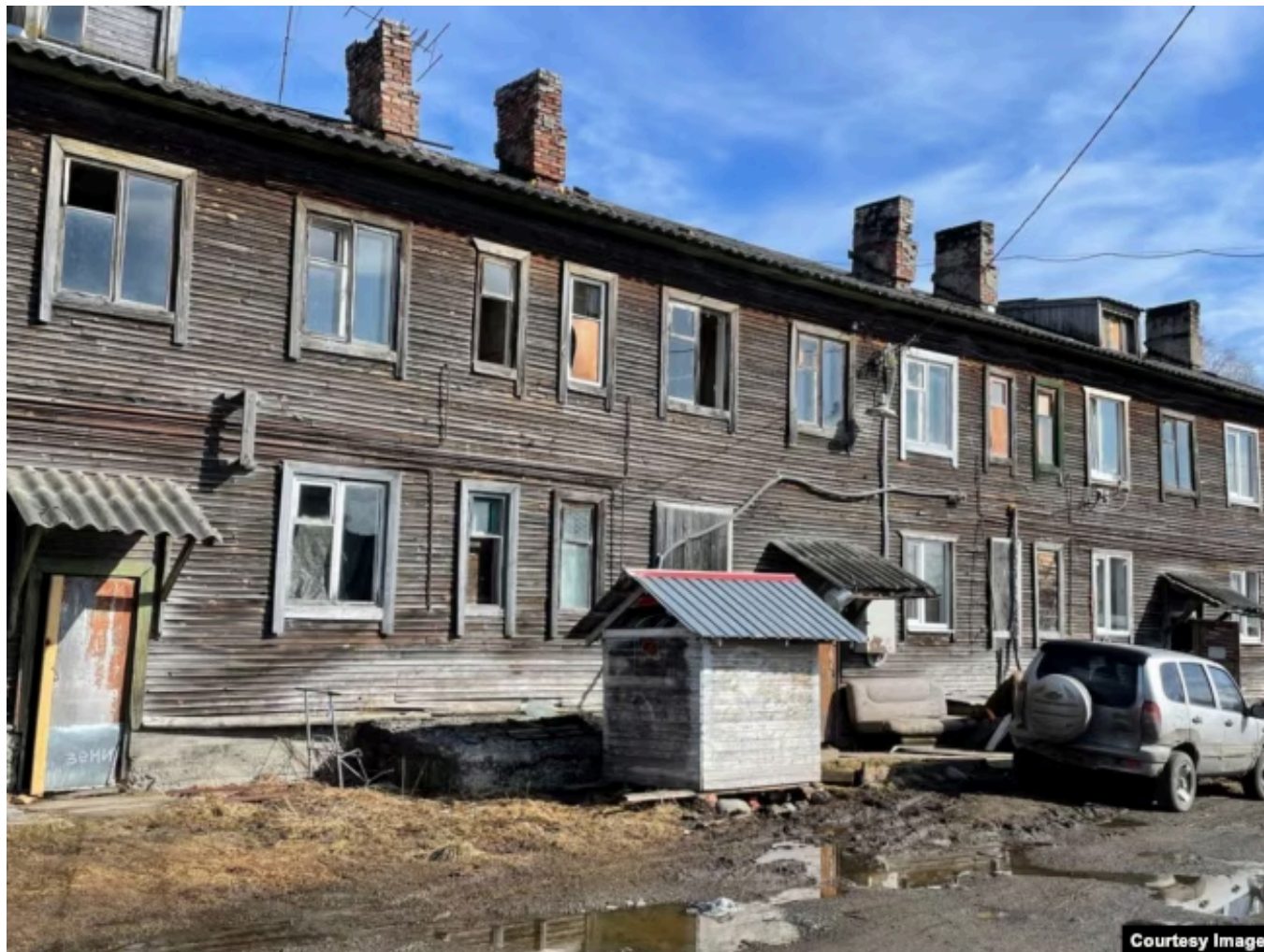
В деревне Хийденсельге