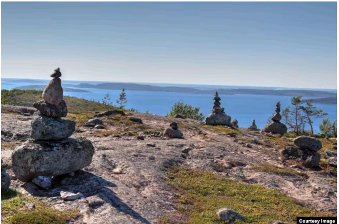
На архипелаге Кузова

Кто-то призывает ограничить поток туристов, придать природным объектам статусы охраняемых зон и нацпарков. Кто-то считает, что и это не поможет.