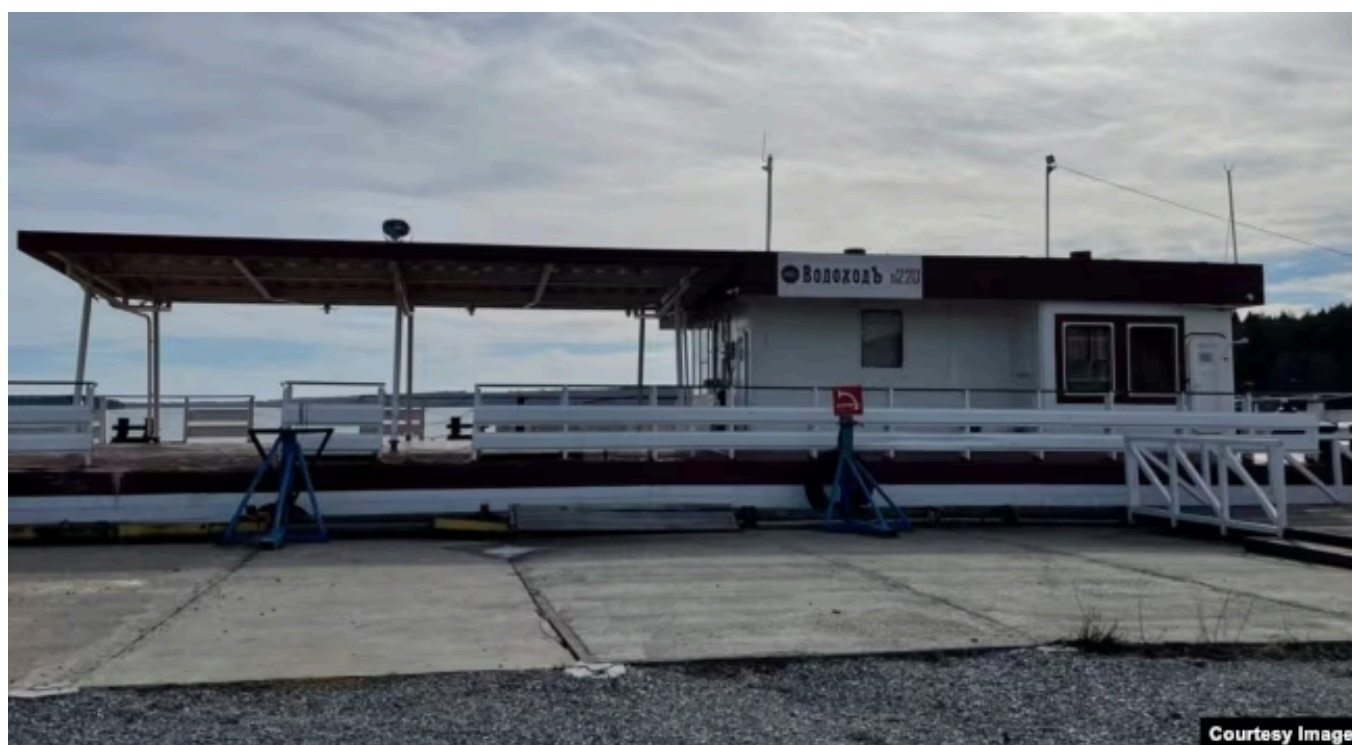
Дебаркадер круизной компании "ВодоходЪ"

Хийденсельга стоит на берегах реки Янисйоки и Ладожского озера, возле национального парка "Ладожские шхеры". Отсюда туристы отправляются на автобусах в Сортавалу, горный парк "Рускеала", к водопаду Ахинкоски и в другие места. В 2025 году лайнеры причаливали 70 раз, деревню посетили более 10 тысяч туристов. Ожидается, что в этом сезоне рейсов будет уже более 100.