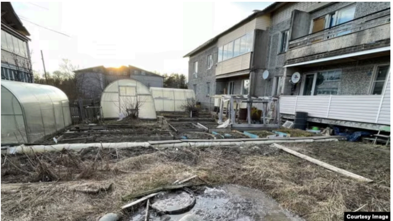
Канализационные стоки во дворах