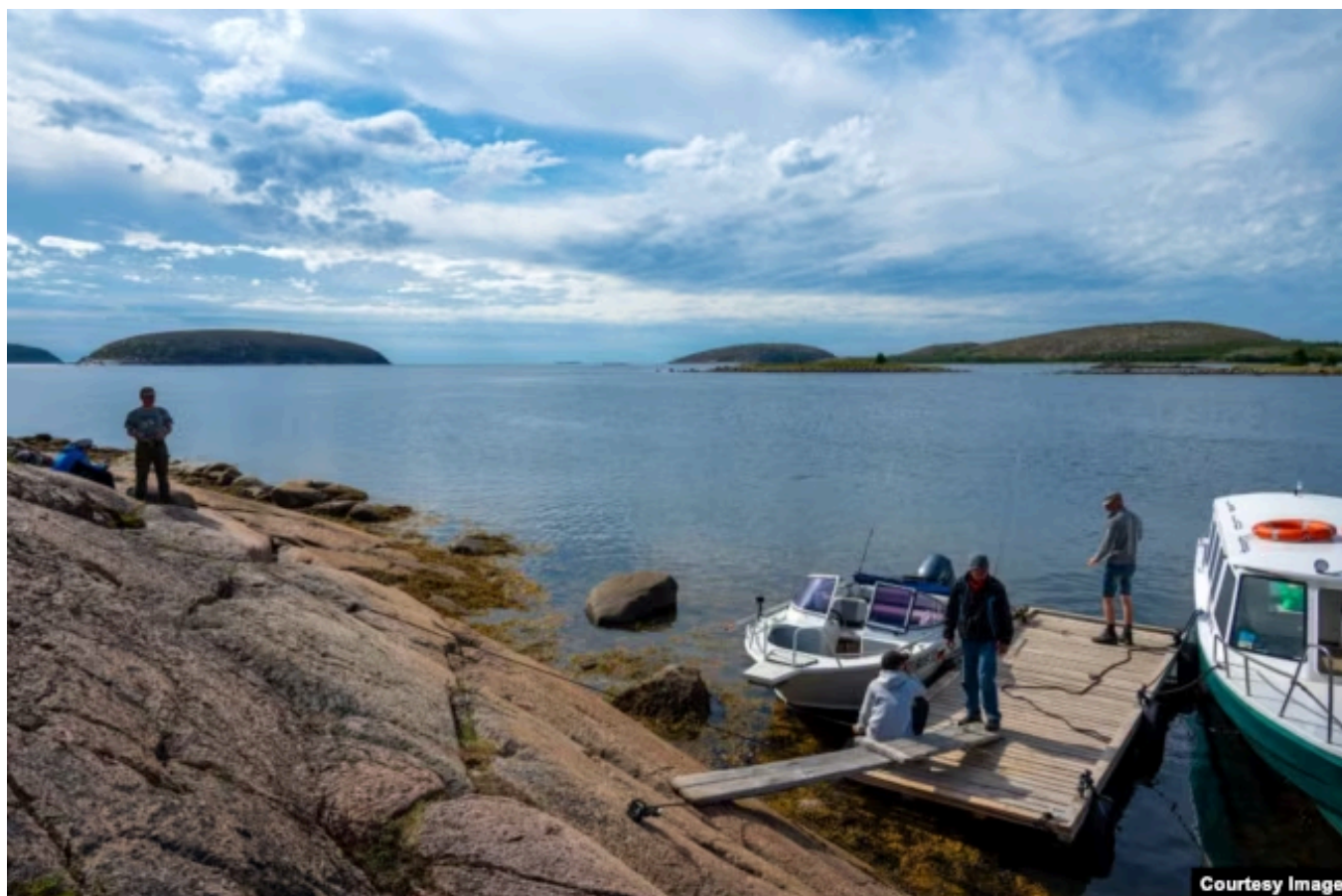
На архипелаге Кузова

– Кузова, например, далеко. Ехать дорого, ночевать негде, доплыть до них – надо лодку искать. Когда я там работала, ее не было. Я ушла недавно. По мнению директора, нужно в офисе сидеть. План по охране на три летних месяца зарубили: денег нет. А мне бесполезная работа не нужна, я не выдержала этой фигни в офисе. Оттуда все бегут. Охранников взять негде, им платить надо. А бюджет-то скудный.