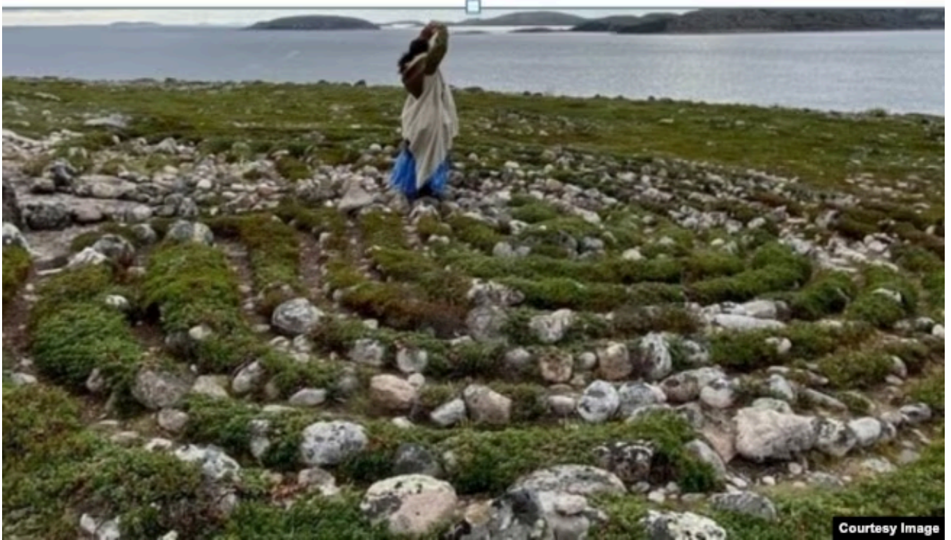
"Духовные практики" туристов на архипелаге Кузова

Кто-то призывает ограничить поток туристов, придать природным объектам статусы охраняемых зон и нацпарков. Кто-то считает, что и это не поможет.