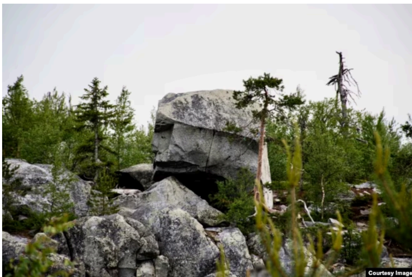
В национальном парке Воттовара