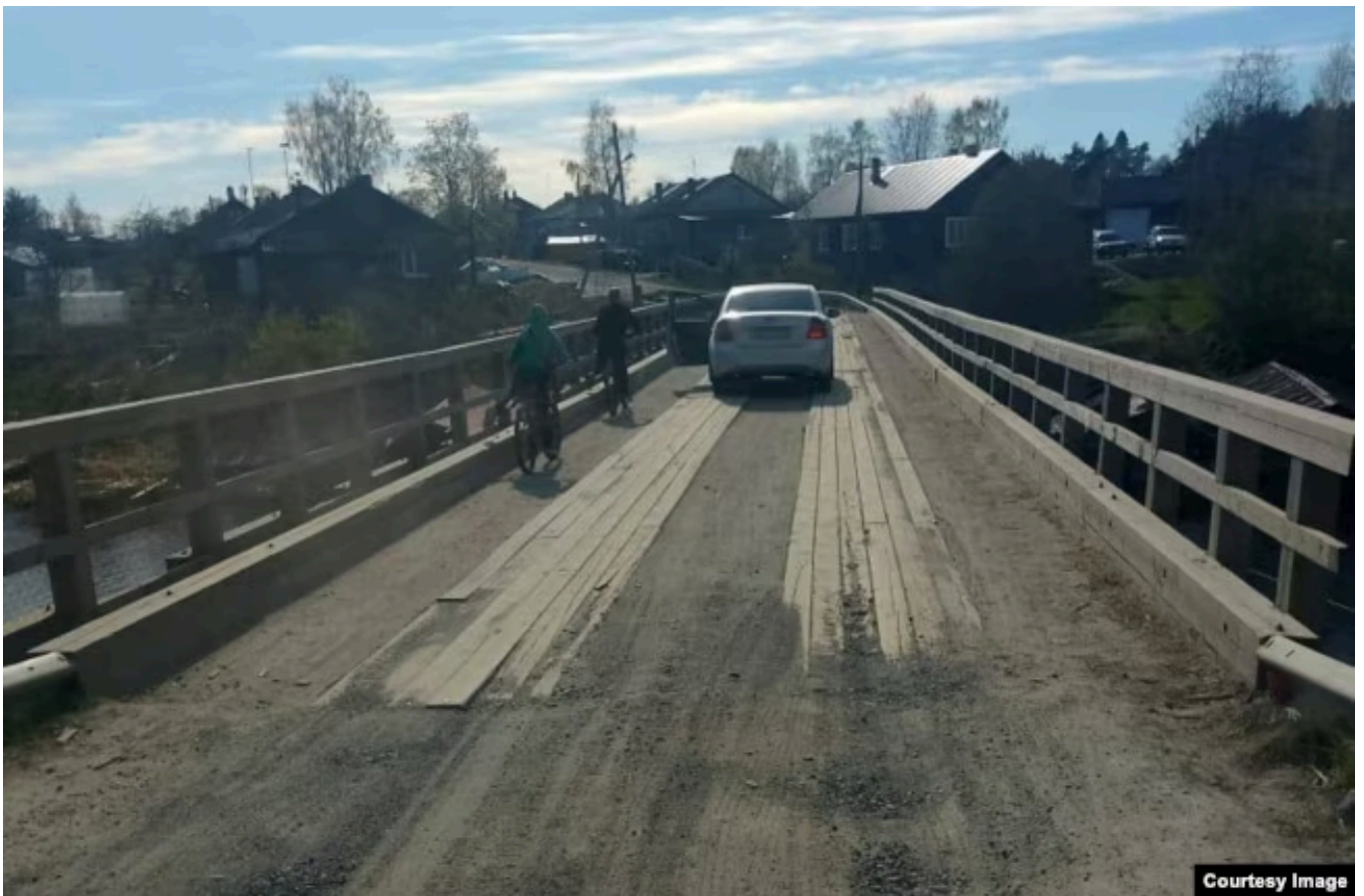
Обветшавший мост через реку Янисйоки

Школу, где учится около 70 детей, местные власти порываются закрыть. Потому что – оптимизация и денег нет.