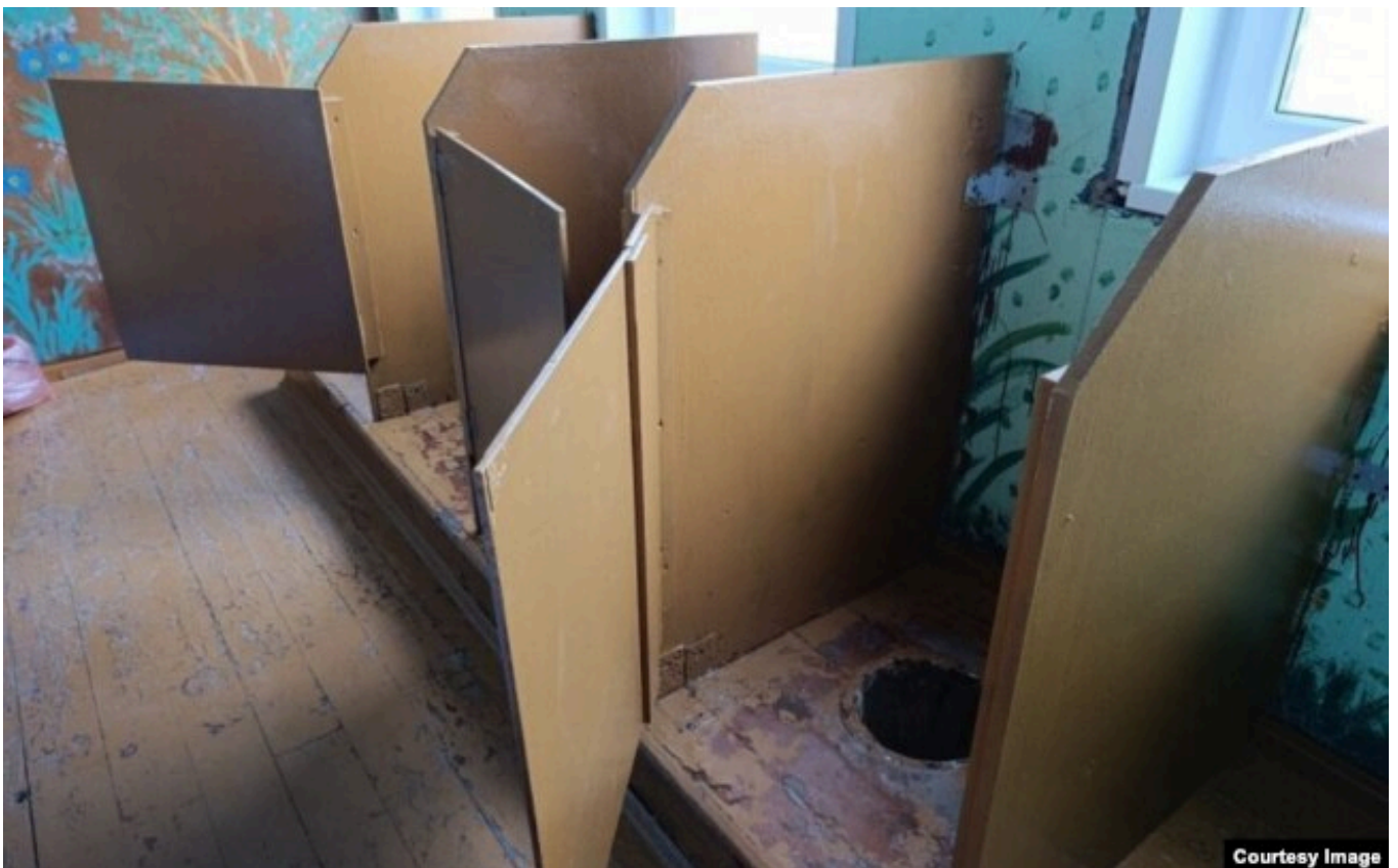
Хийденсельга: школьный туалет

Школу, где учится около 70 детей, местные власти порываются закрыть. Потому что – оптимизация и денег нет.