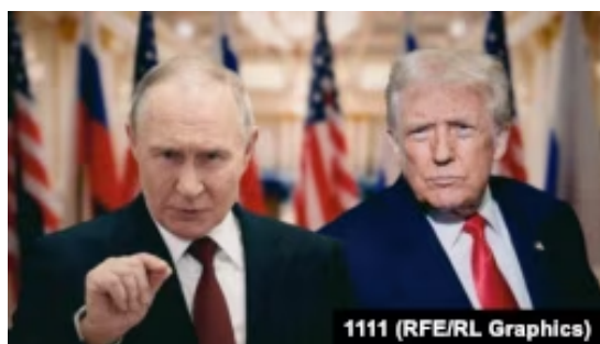
Владимир Путин и Дональд Трамп

Вашингтон. Если Вашингтон действительно усилит свое давление на Москву, если Трамп что-то предложит Путину или, наоборот, станет чем-то угрожать, Путину придётся отступить. Но он отступит не под давлением Зеленского или Европы, с которыми они никак не хотят считаться. А под давлением США, а это совсем другое дело. Все это они могут подать в обёртке какого-то «тайного соглашения» - Россия согласилась остановить военные действия в рамках этого тайного соглашения.