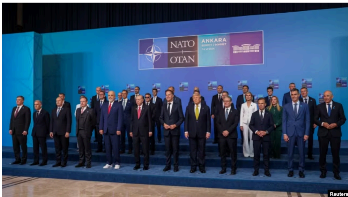
Лидеры стран НАТО позируют для совместного фото на саммите в Анкаре. 8 июля 2026 года

Представители многих стран НАТО утверждают сегодня, что Россия, получившая бесценный практический боевой опыт в боях в Украине и вынашивающая все более агрессивные имперские амбиции, будет готова к войне с альянсом к 2029 году. В связи с этим на Европу ложится задача повысить свою готовность к нападению, а на США – хотя бы не создавать тем временем для НАТО ненужных проблем.