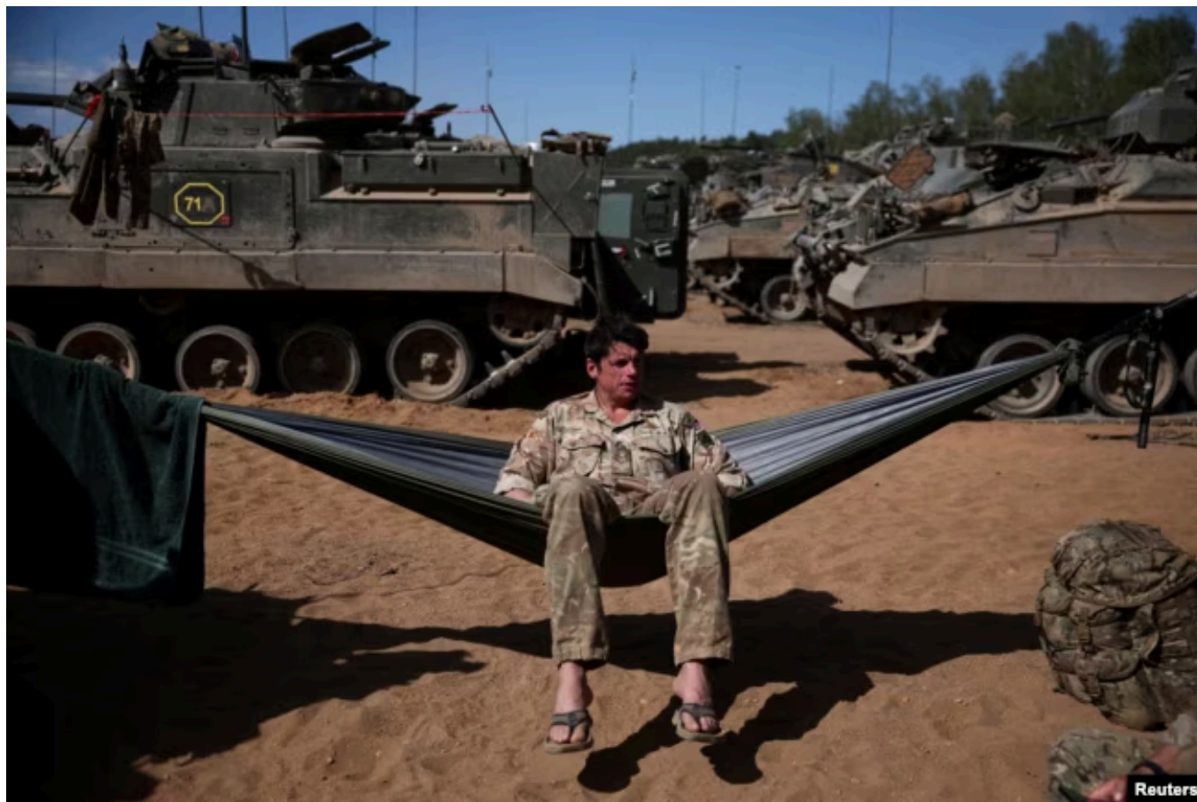
Британские танкисты в Польше на берегу Балтийского моря во время совместных учений НАТО Exercise Steadfast Defender 2024, 15 мая 2024 года

При этом представители США и НАТО совместно признают, что европейским армиям просто не хватает личного состава. Например, в наши дни численность британской армии упала до самого низкого уровня со времен битвы при Ватерлоо в 1815 году – сегодня в ее рядах насчитывается менее 70 тысяч штатных подготовленных военнослужащих.