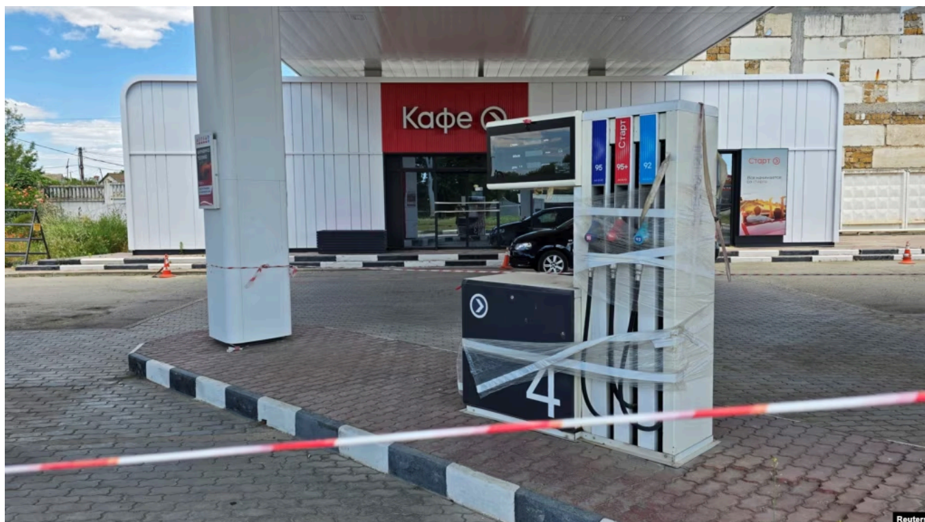
Неработающая АЗС в Крыму

Росстат 8 июля выпустил еженедельный отчёт о ценах на бензин в регионах России, а также подконтрольных России территориях Украины. Из отчёта следует, что за неделю в аннексированном Крыму топливо подорожало в среднем на 78,4%, то есть почти в два раза. При этом, как обратили внимание журналисты издания The Bell, ведомство обычно пишет в отчёте, в каких регионах рост цен был самым значительным, но на этот раз не стало этого делать. То, что на первом месте по этому показателю оказался именно Крым, выяснила "Медиазона", изучив отчёт. На прошлой неделе лидером по росту цен был аннексированный Севастополь.