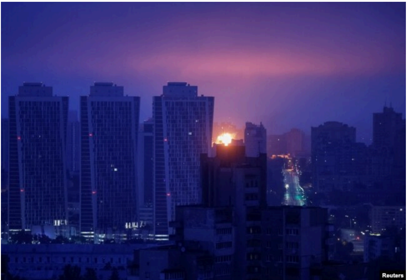
Атака дронов в Киеве, 21 июля 2025 года

Но большинство экспертов из стран Балтии сходятся во мнении, что речь скорее может идти о точечных провокациях, а к прямому противостоянию со странами Балтии Россия в обозримом будущем не готова: для этого ей придется воевать не только с Латвией, Литвой и Эстонией, но также с Польшей, Финляндией и Швецией.