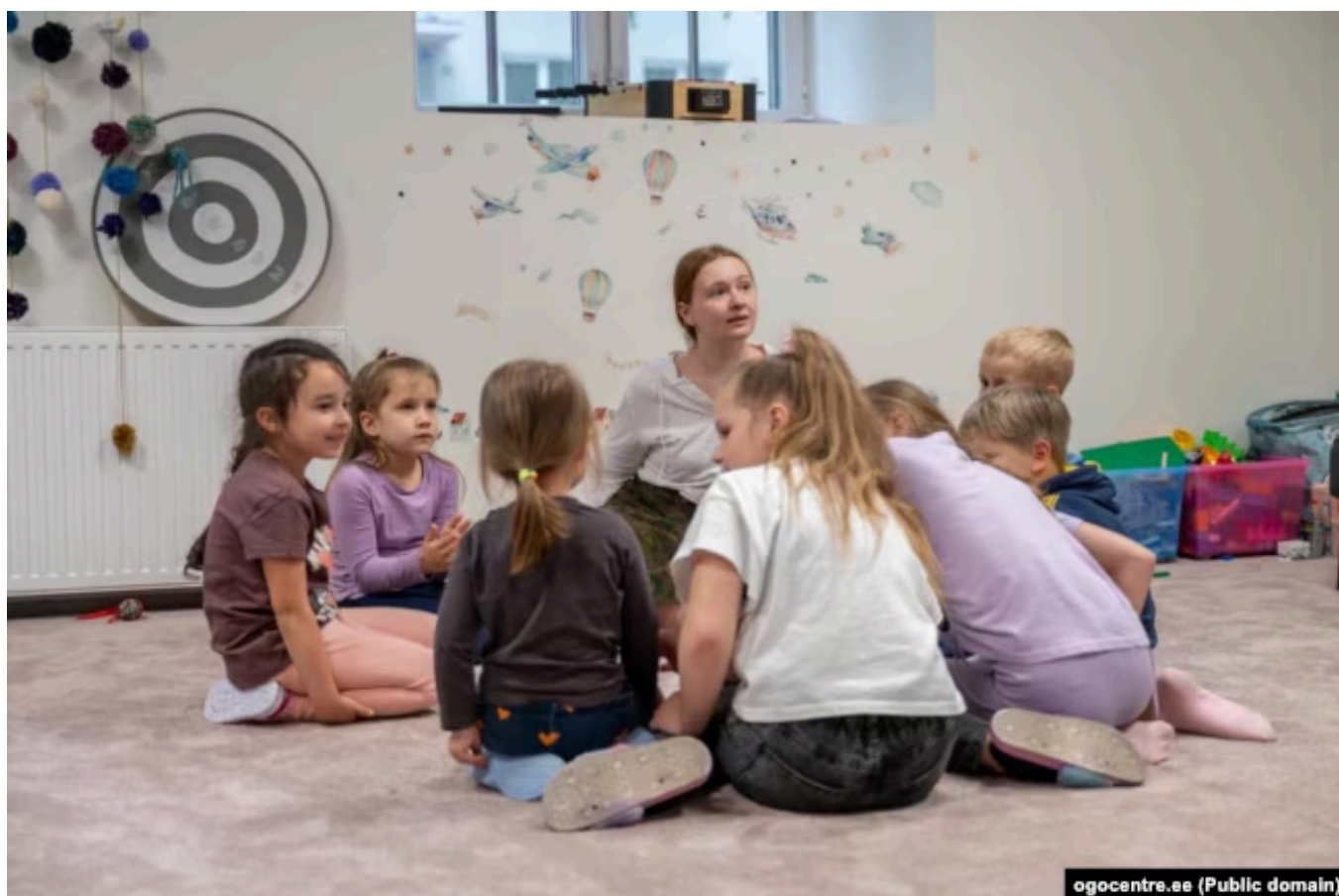
Занятия в OGO Centre

Центр для детей в Таллине существует на частные пожертвования. Сейчас проводится благотворительный аукцион "Поддержите детей вместе со звездами", чтобы собрать средства на летние каникулы для детей. "Спрос на городские лагеря