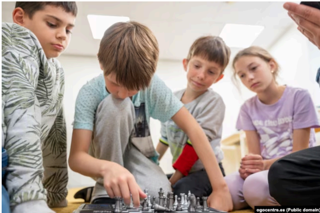
Дети в OGO Centre