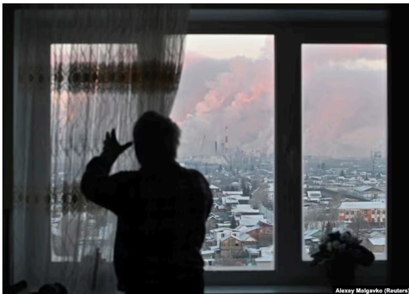
Вид на нефтеперерабатывающий завод в Омске из квартиры жителя города, Россия, 18 ноября 2022 года