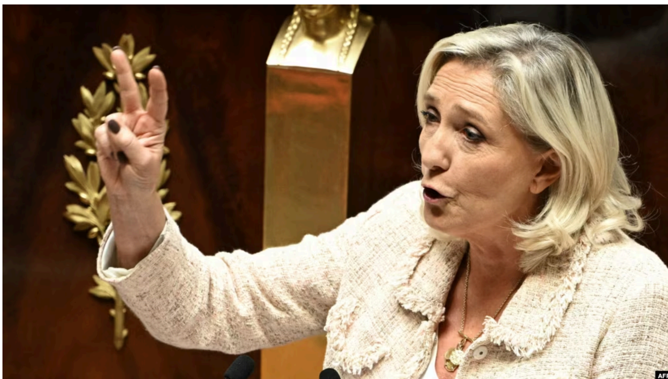
Марин Ле Пен

Французский апелляционный суд во вторник оставил в силе обвинительный приговор лидеру правопопулистского "Национального объединения" Марин Ле Пен по делу о нецелевом использовании средств ЕС. При этом суд сократил до 15 месяцев срок запрета лидеру ультраправых занимать выборные должности, сохранив для неё возможность баллотироваться на президентских выборах 2027 года.