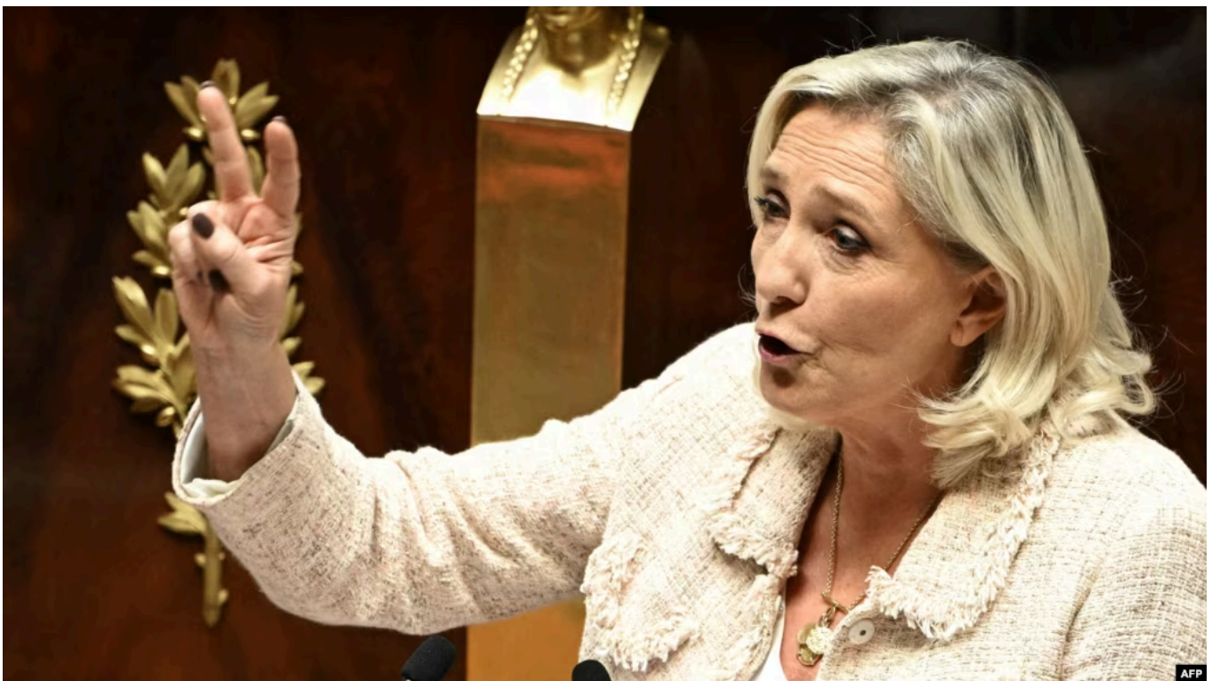
Марин Ле Пен

Французский апелляционный суд во вторник оставил в силе обвинительный приговор Марин Ле Пен по делу о нецелевом использовании средств ЕС. При этом суд сократил до 15 месяцев срок запрета лидеру ультраправых занимать выборные должности, теоретически тем самым сохранив для неё возможность баллотироваться на президентских выборах 2027 года.