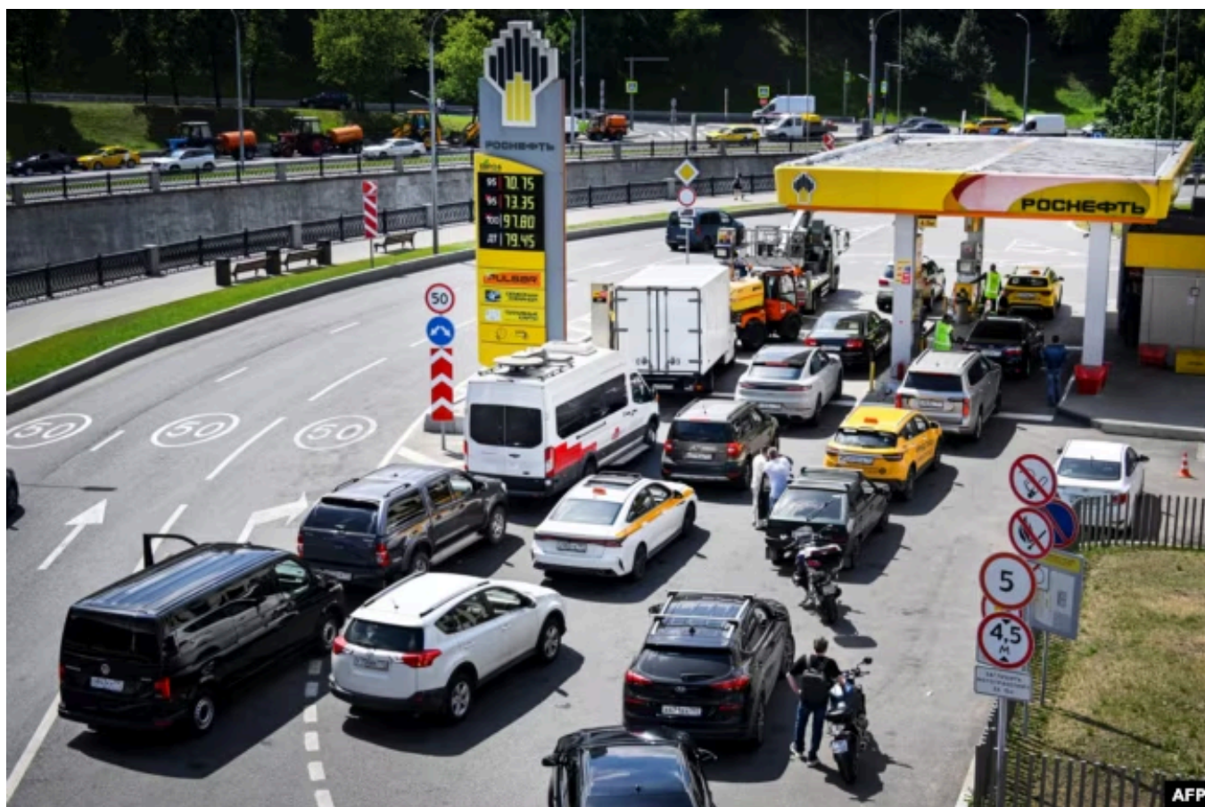
Очередь на одной из московских АЗС

пессимистов очень близко к тому, что демонстрируют опросы, которые проводятся по заказу Банка России. Там около трети составляют те, кто зарабатывают больше, чем тратят, имеют хоть какие-то сбережения и, соответственно, выигрывают от высоких ставок. Примерно две трети регулярно жалуются на то, что им приходится экономить.