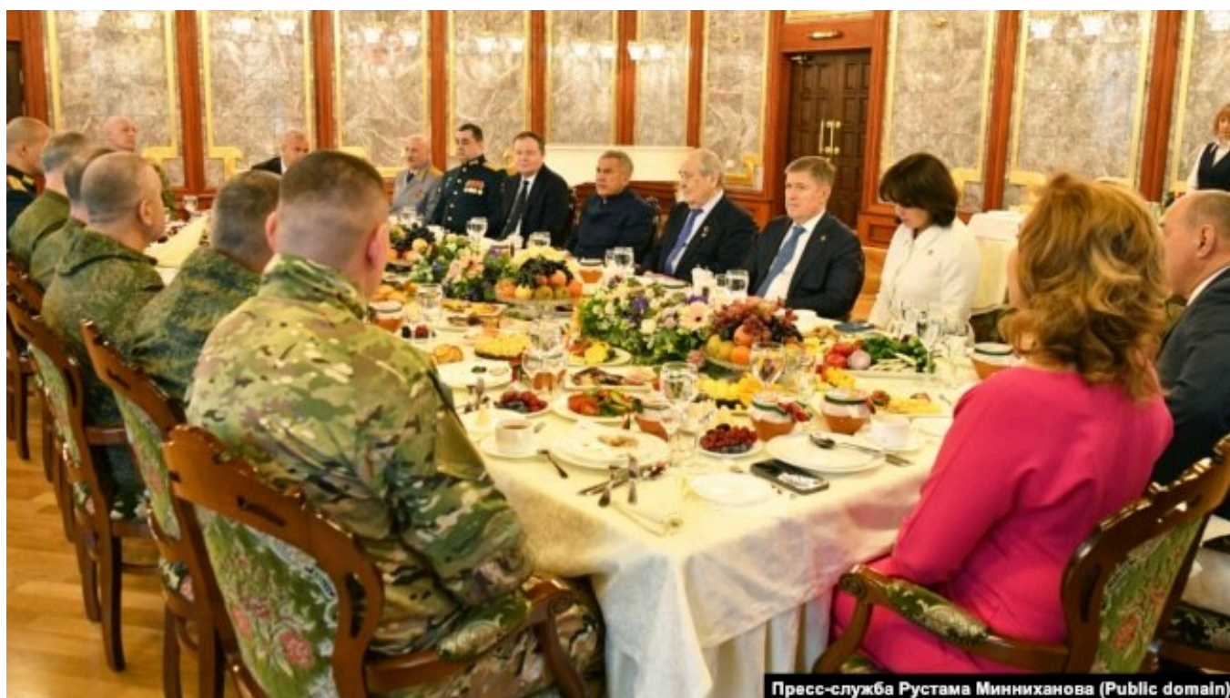
Рустам Минниханов на встрече с участниками войны против Украины. 23 февраля 2024 года

В прошлом году число открытых вакансий колебалось от 35 до 40 тысяч. Верхнее значение было актуально на конец декабря. То есть буквально каждый месяц количество вакансий растет, что напрямую демонстрирует: республике не хватает людей. Заметим, что нехватка острее ощущается преимущественно в "мужских профессиях" — строительстве и промышленности.