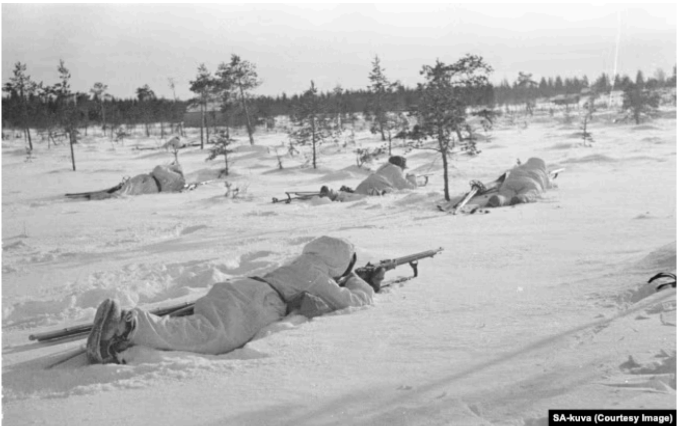
Финские стрелки во время "зимней войны" 1939-40 годов

Финляндия по условиям перемирия с СССР и Великобританией 19 сентября 1944 года была вынуждена признать границы 1940 года, а также уступить СССР район Петсамо. Дополнительными условиями были: сдача СССР в аренду для устройства военной базы на 50 лет полуострова Порккала вблизи Хельсинки, предоставление СССР прав транзита войск через Финляндию, репарации в размере 300 миллионов долларов США, которые должны быть погашены поставками товаров в течение 6 лет, отмена запрета компартии.