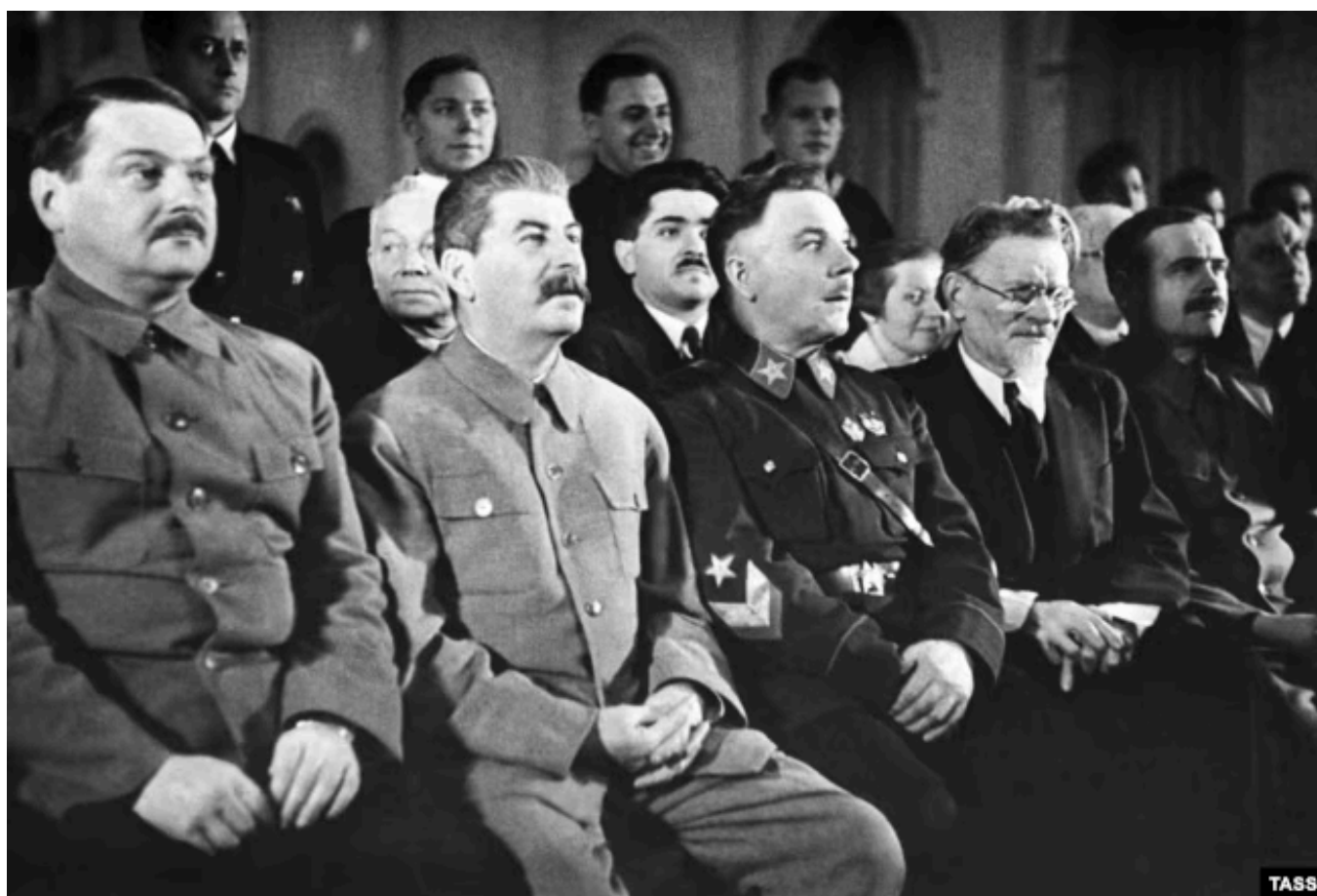
Андрей Жданов (слева), фактический послевоенный сталинский "наместник" в Финляндии, со Сталиным и другими руководителями СССР