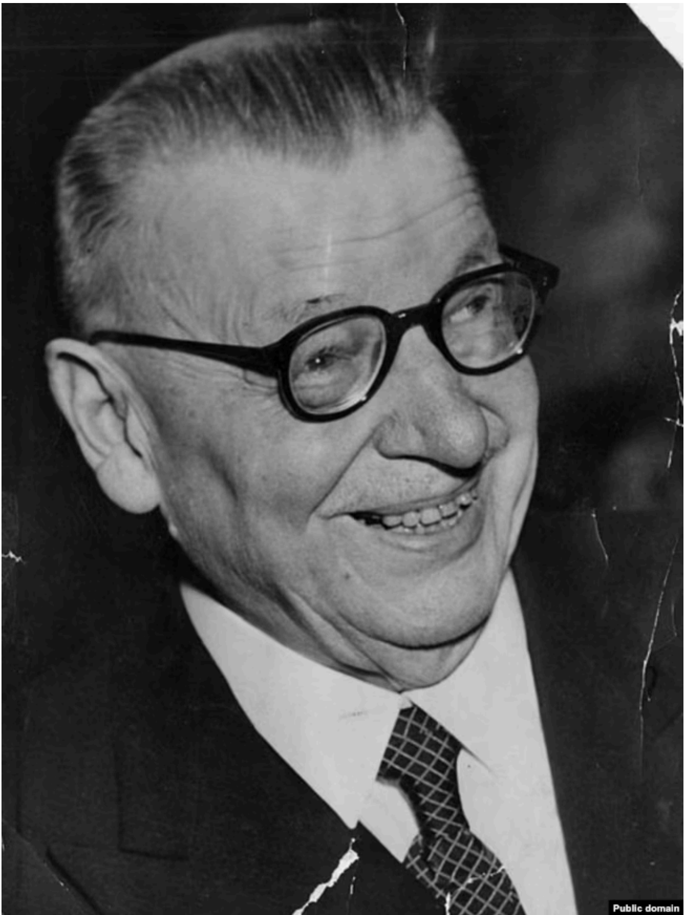
Юхо Кусти Паасикиви, президент Финляндии в 1946-1956 гг.

В 1948 году, после формирования правительства без участия коммунистов, торговые отношения несколько ухудшились, переговоры о торговом договоре не были результативны. Мероприятия социал-демократического правительства Фагерхольма – устранение крайне левых с ключевых постов в государственном