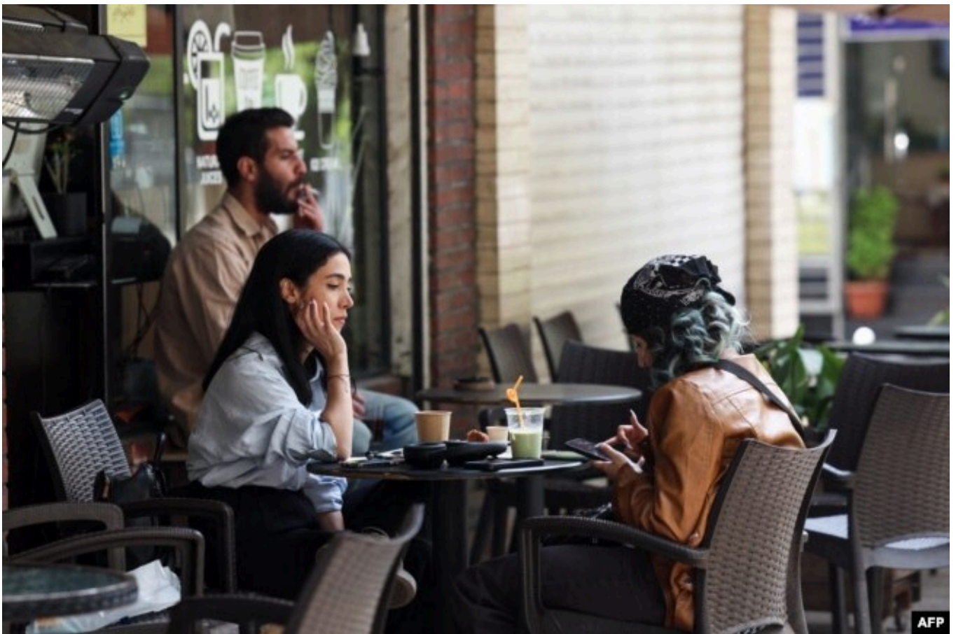
Посетители одного из тегеранских кафе

"Я уже очень давно не видела никаких патрулей, контролирующих ношение хиджаба, – говорит жительница Тегерана, решившая не называть свое имя. – Женщины одеваются так, как им нравится".