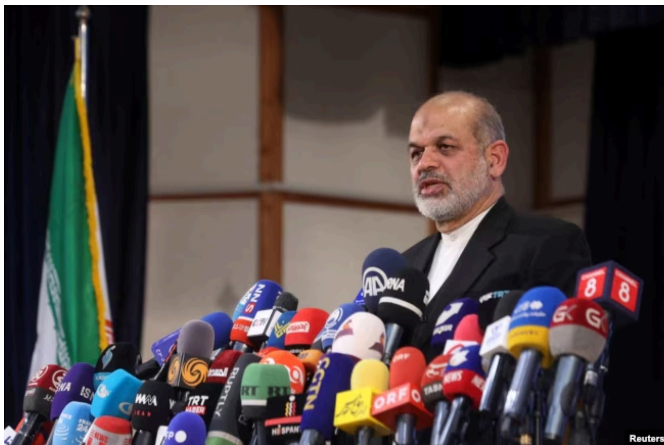
Ахмад Вахиди, нынешний командующий КСИР

Самый громкий скандал был связан с популярной политической программой "Сараи". Во время прямого эфира приглашённые политики начали буквально клеймить членов переговорной делегации как предателей Ирана, ислама и Аллаха. По имеющейся информации, вмешались лично либо Галибаф, либо президент Пезешкиан, после чего растерявшееся руководство телевидения просто остановило прямой эфир.