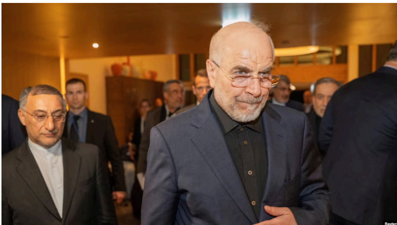
Спикер парламента Ирана Мохаммад-Багер Галибаф

Официальные лица, представляющие Иран на переговорах с США по выработке мирного соглашения, постоянно подчеркивают, что переговоры проходят в атмосфере недоверия к Соединенным Штатам и обвиняют их в неверной интерпретации уже достигнутых договоренностей. Но сообщения о событиях в самом Иране заставляют предположить, что в политической верхушке страны нет согласия по поводу того, какими должны быть мирные договоренности с Вашингтоном. И должны ли они быть вообще.