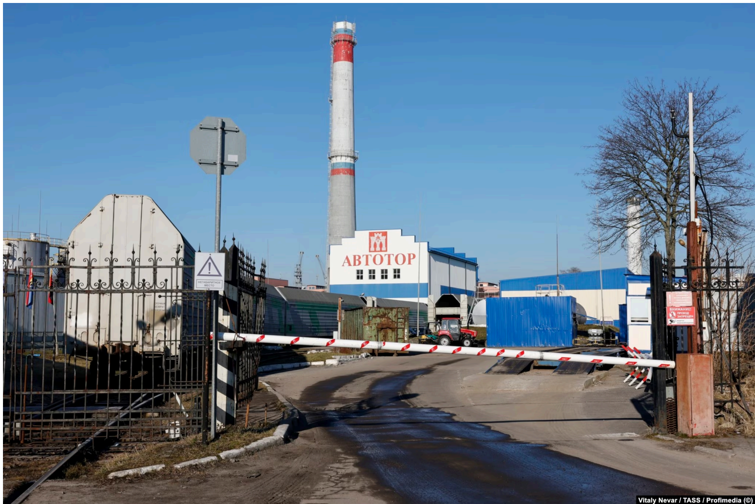
Завод "Автотор", март 2022 года

Количество новых BMW, зарегистрированных в России, заметно выросло в последние месяцы, однако открытые данные не позволяют узнать, где именно были произведены эти автомобили.