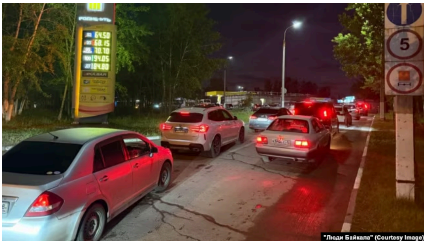
Иркутск, очередь за бензином