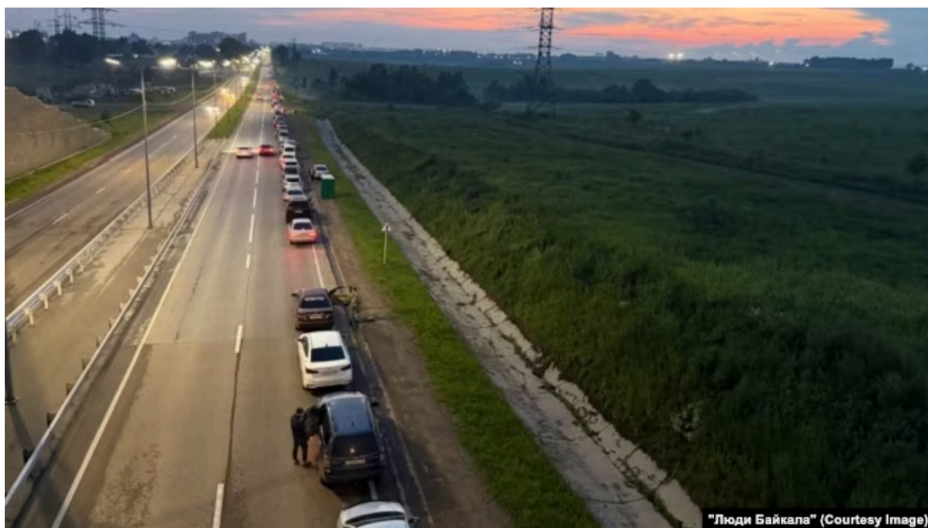
Иркутск, очередь за бензином

Бензиновый кризис в разгар отпускного сезона заставляет многих менять свои планы на отдых. Очень мало туристов на многолюдном в это время года Ольхоне, нет обычных очередей на паром. Гораздо меньше машин и в самом городе.