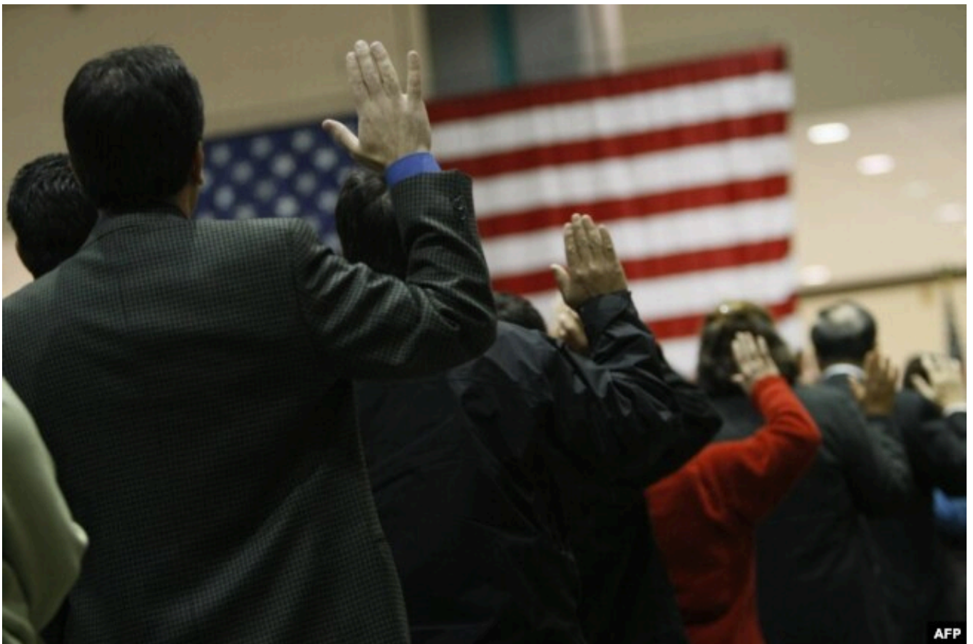
Церемония натурализации, Лос-Анджелес

Мониторинг соцсетей, пишут аналитики Центра Бреннана, в том числе с применением алгоритмов, отличается низкой эффективностью вследствие незнания культурных реалий и неумения отличить юмор от серьезного текста. В 2012 году гражданина Ирландии не пустили в США из-за двух твитов: в одном было сказано, что он собирается "разрушить Америку" (на британском молодежном сленге – устроить бурную вечеринку) и "откопать Мэрилин Монро" (фраза из культового американского анимационного ситкома "Семейный парень", высмеивающего американские устои). Это редкий случай, когда причина отказа во въезде стала известна. Как правило, процедура совершенно непрозрачна.