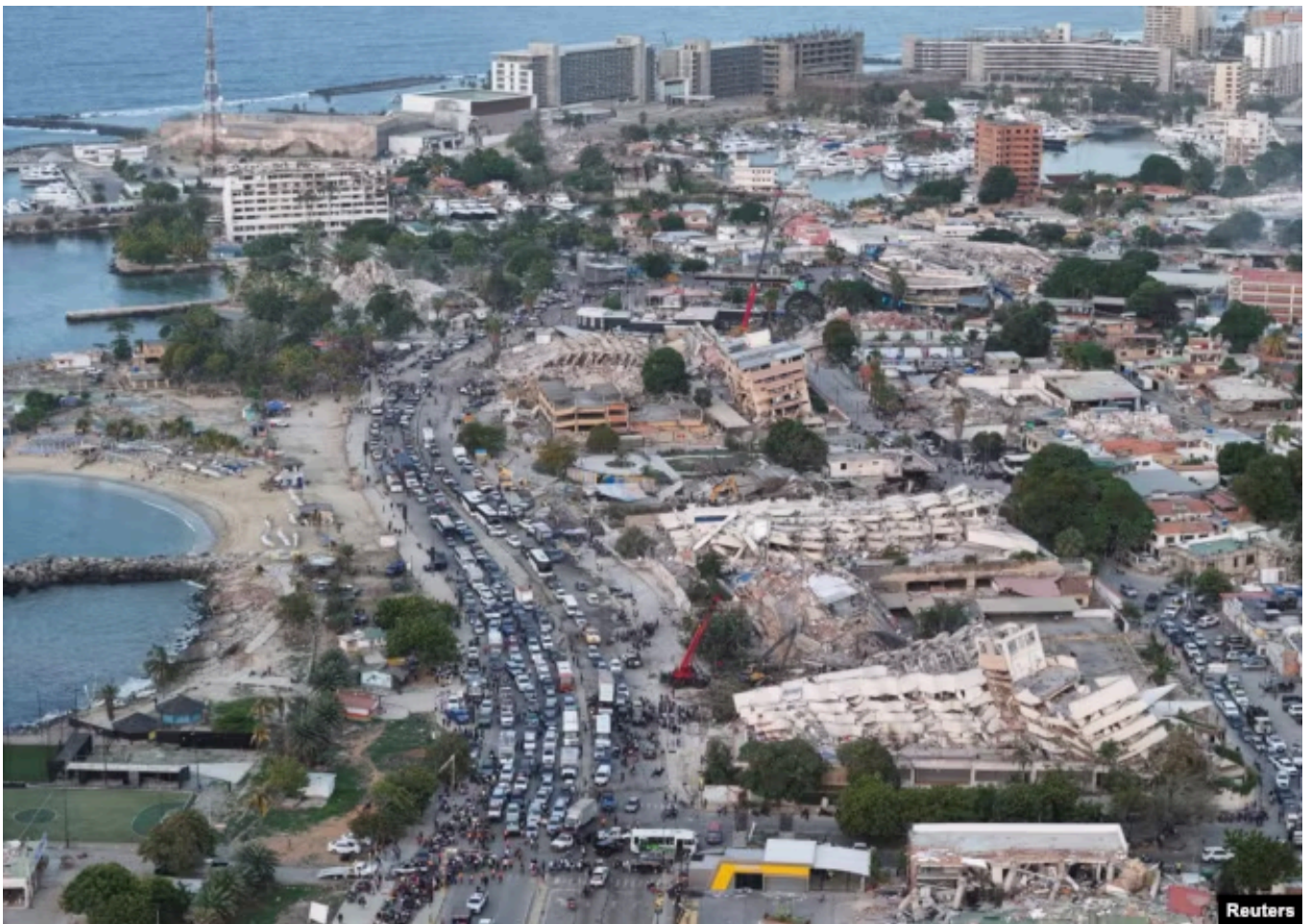
Ла-Гуайра, Венесуэла, 26 июня 2026 года

ООН оценила ущерб от землетрясений в 6,7 миллиарда долларов, что эквивалентно 6% ВВП Венесуэлы.