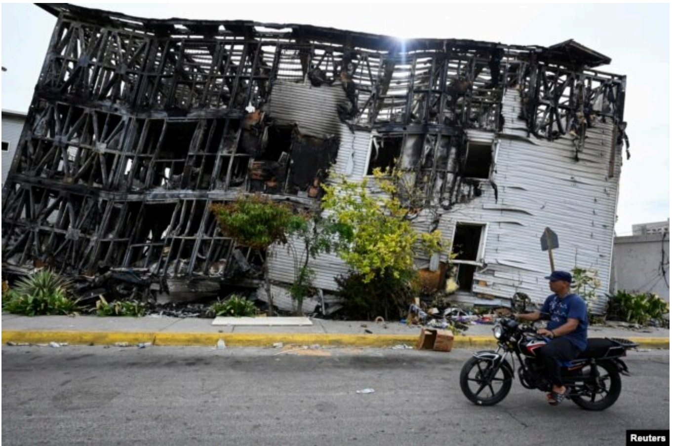
Ла-Гуайра, Венесуэла, 26 июня 2026 года

Поисково-спасательные работы осложняются повторными толчками. С момента первых землетрясений было зафиксировано около 500 афтершоков, включая землетрясение магнитудой 5,2, которое произошло утром в понедельник. На данный момент в поисках участвуют более двух тысяч спасателей из 27 стран.