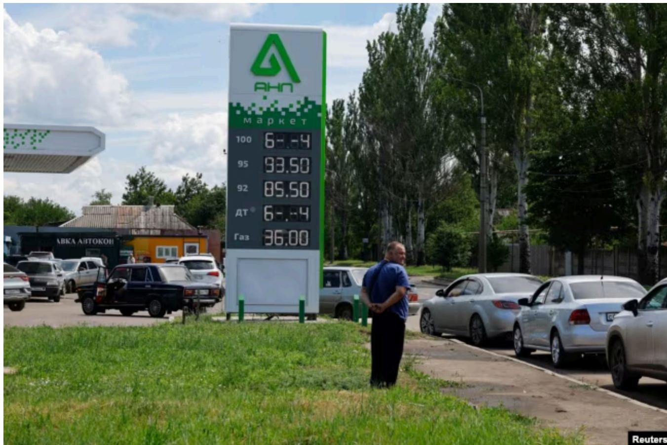
Очередь на автозаправку в оккупированном Донецке

Есть и еще одна проблема с импортом бензина. Путин настаивает на том, чтобы цены на внутреннем рынке не росли. То есть правительство не просто лишится части нефтяных доходов, которые раньше шли от экспорта нефтепродуктов, но еще и вынуждено будет раскошелиться в рамках механизма "топливного демпфера" на компенсацию разницы между ценой импортного бензина и стоимостью бензина на российских заправках.