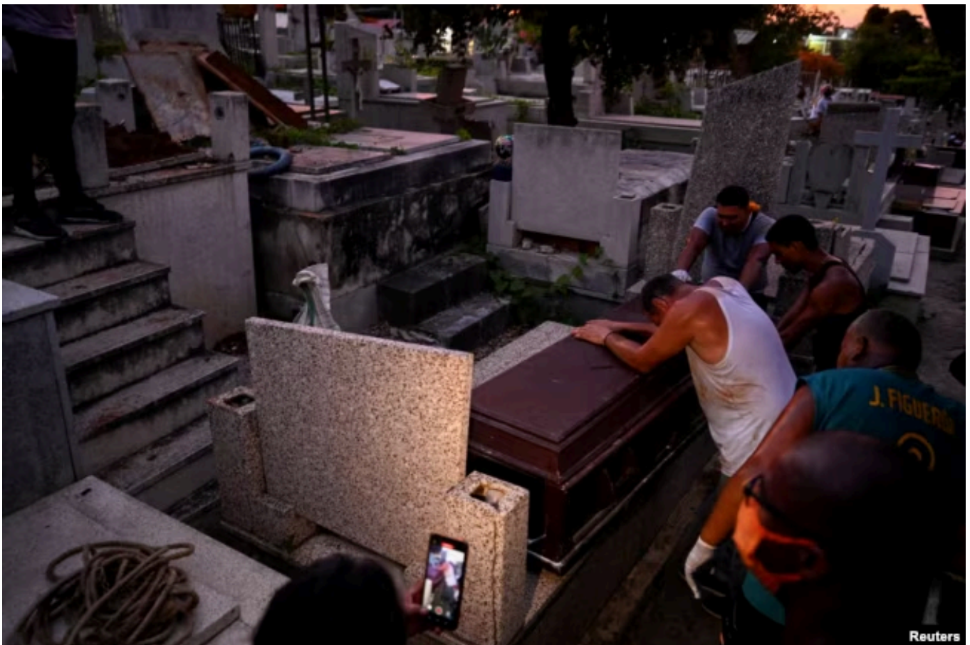
Похороны одной из жертв землетрясения в штате Ла-Гуайра. 28 июня 2026 года

По словам председателя Национальной ассамблеи Венесуэлы Хорхе Родригеса ( брата временного президента страны Дельси Родригес), не менее 12 тысяч 700 человек совсем лишились жилья или были вынуждены покинуть свои разрушенные дома. Он также сообщил, что всего в Каракасе и окрестностях рухнули или очень сильно повреждены 774 здания. Власти объявили, что все школы страны теперь закрыты – они переоборудуются под временные убежища и центры распределения гуманитарной помощи для людей, оставшихся без крова.