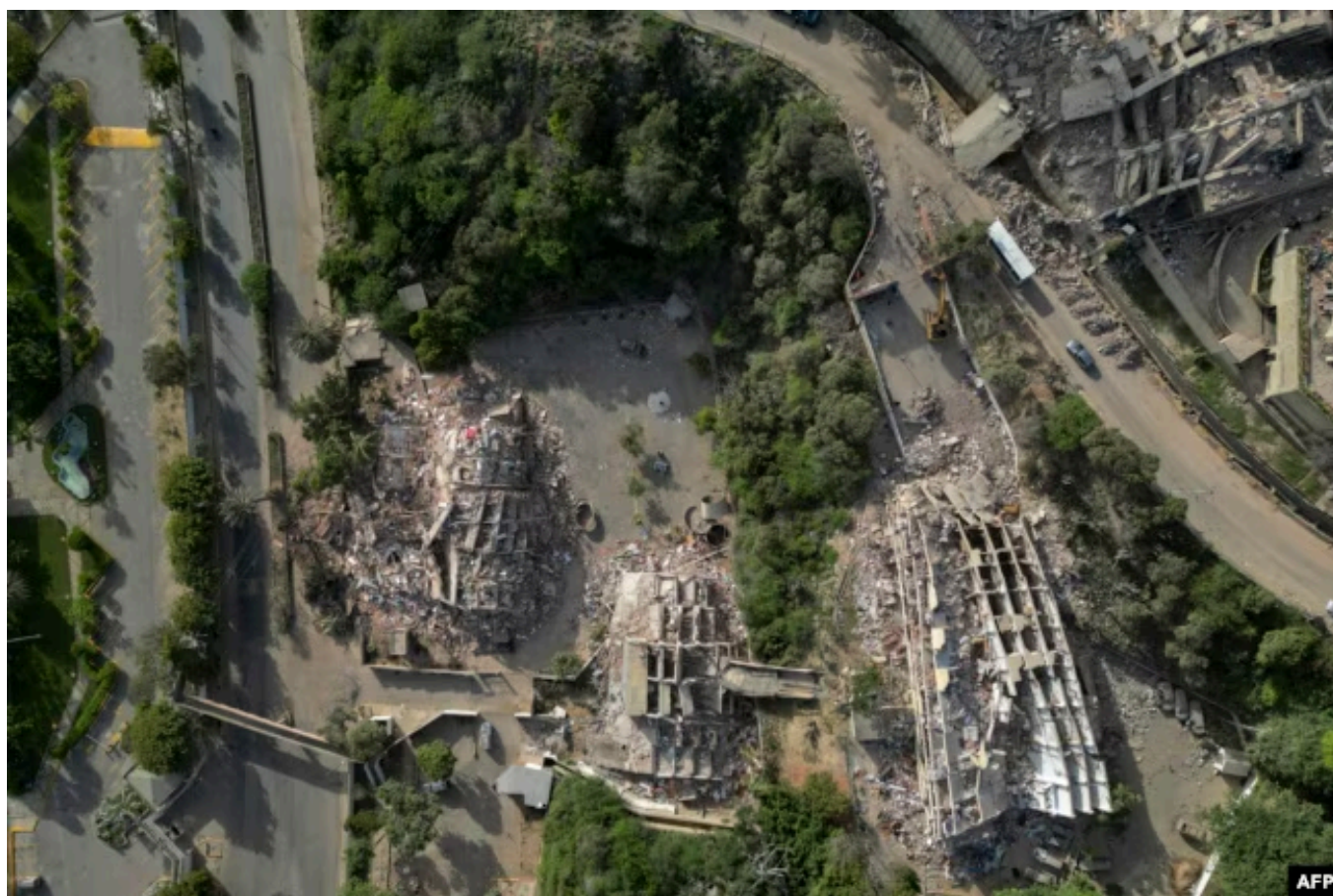
Вид с воздуха на разрушенные здания в городе Катиа-ла-Мар в штате Ла-Гуайра. 27 июня 2026 года

Ограничение доступа к информации. Власти закрыли доступ ко многим зонам бедствия и запретили журналистам и гуманитарным организациям работать там без специального разрешения, что вызвало новые подозрения в сокрытии реальных масштабов трагедии.