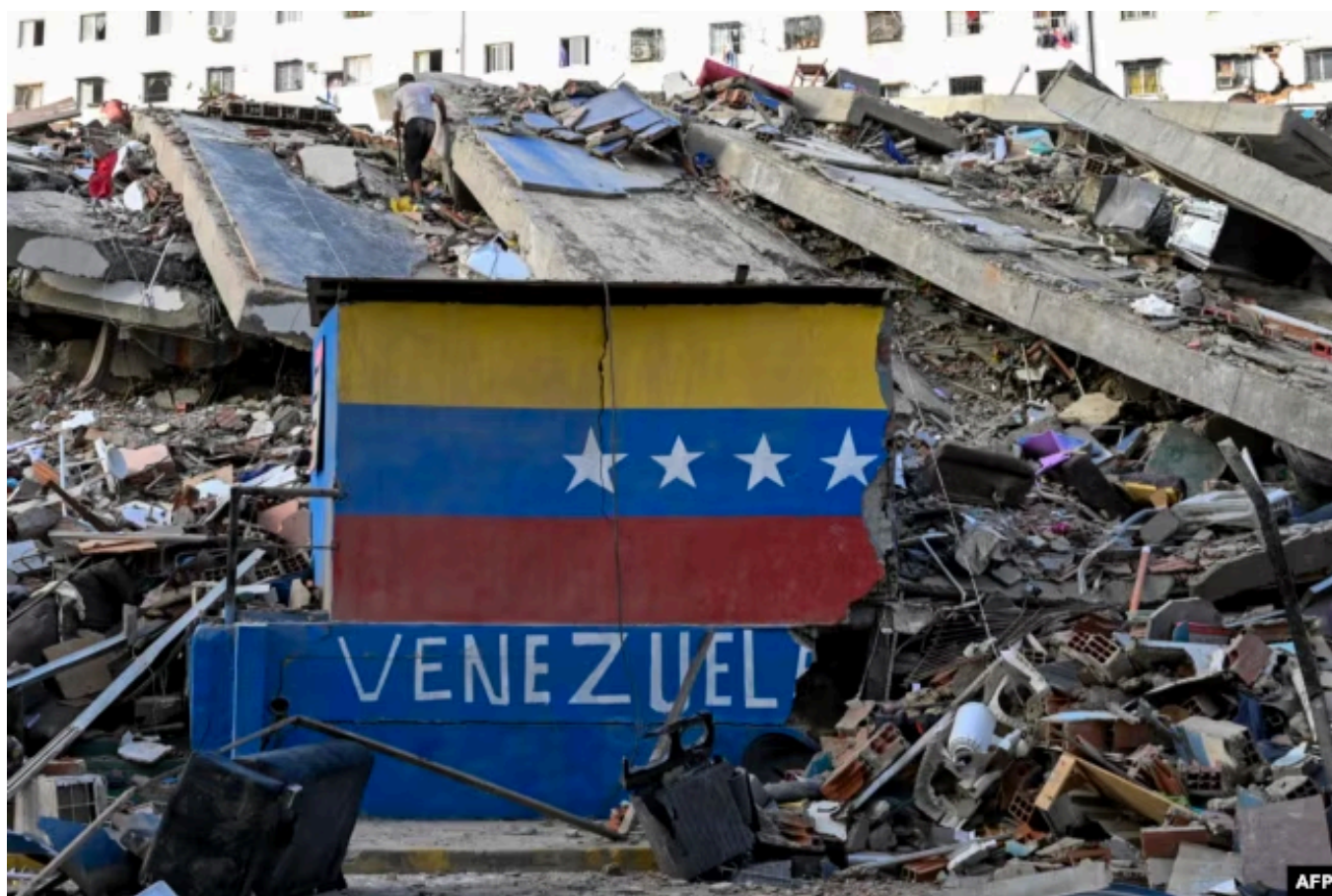
Венесуэльский флаг на обломках здания в городе Карабальеда в штате Ла-Гуайра. 27 июня 2026 года

Эти команды используют акустические радары и специальные детекторы, чтобы улавливать стуки под бетонными плитами. За последние сутки удалось достать из под обломков несколько десятков выживших, включая два совершенно чудесных спасения – 15-летней девочки с ее собакой в Каракасе и новорожденного младенца в Ла-Гуайре. Спутниковый центр ООН (UNOSAT) и европейская система Copernicus были в экстренном режиме подключены к этим работам. Они непрерывно составляют карты разрушений, направляя спасателей к наиболее пострадавшим точкам.