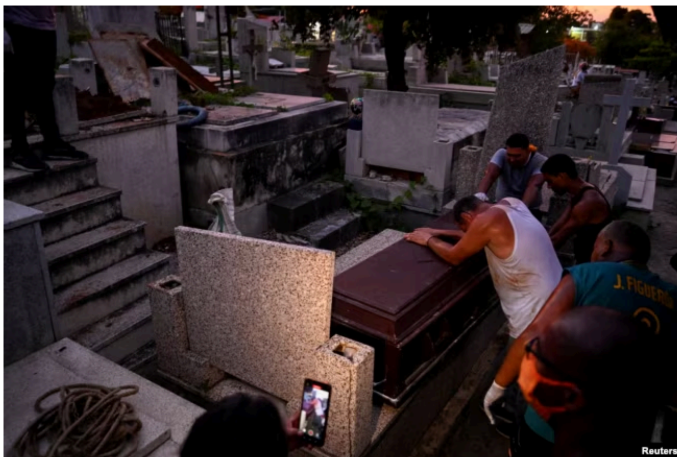
Похороны одной из жертв землетрясения в штате Ла-Гуайра. 28 июня 2026 года

По словам председателя Национальной ассамблеи Венесуэлы Хорхе Родригеса ( брата временного президента страны Дельси Родригес), не менее 12 тысяч 700 человек совсем лишились жилья или были вынуждены покинуть свои разрушенные дома. Он также сообщил, что всего в Каракасе и окрестностях рухнули или очень сильно повреждены 774 здания. Власти объявили, что все школы страны теперь закрыты – они переоборудуются под временные убежища и центры распределения гуманитарной помощи для людей, оставшихся без крова.