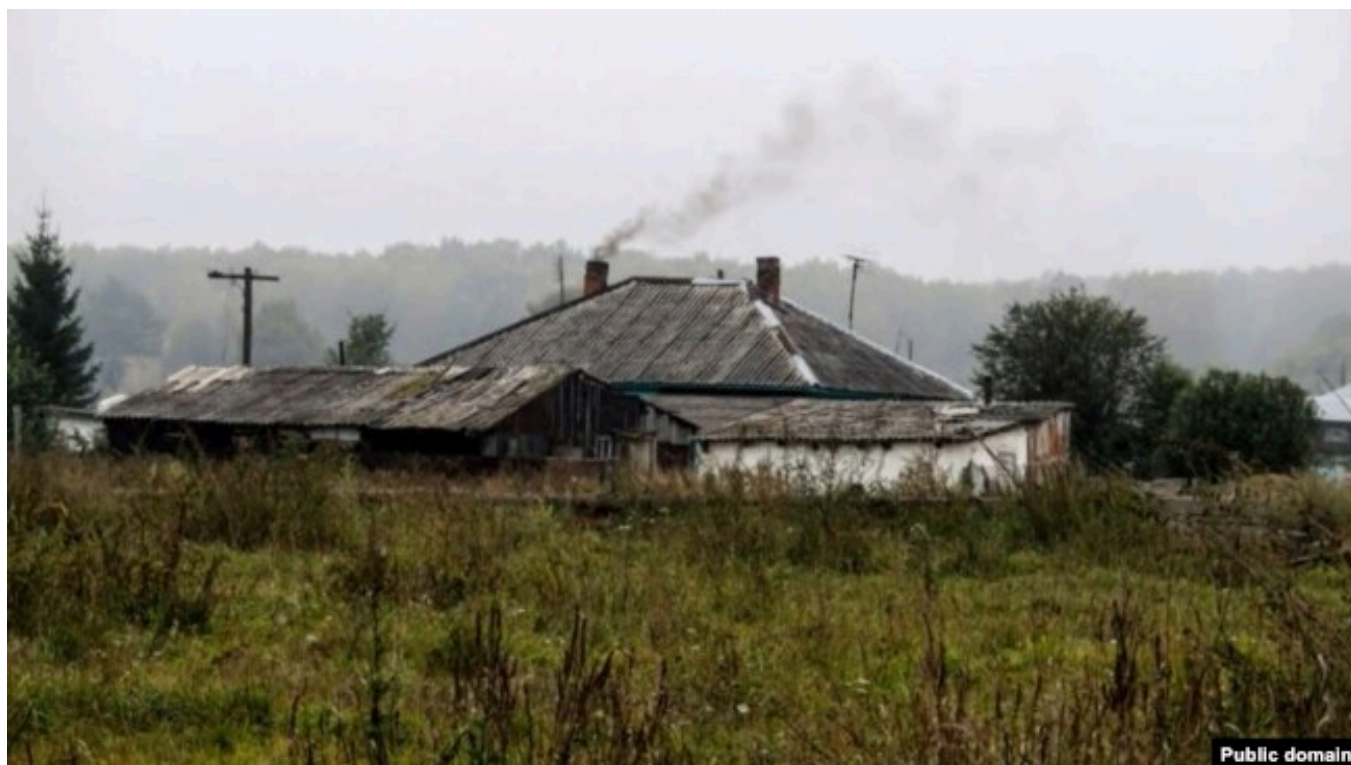
деревня Калинкино, Кузбасс

Принято считать, что деревня Калинкино была основана на реке Ина в XIX веке крестьянами-переселенцами из европейской части России Калинкиными, по фамилии которых и назвали поселение. Деревенские земляков с такой фамилией не помнят. Но помнят, как в начале XX века в деревню пришла вторая волна переселенцев из Украины и Калужской области.