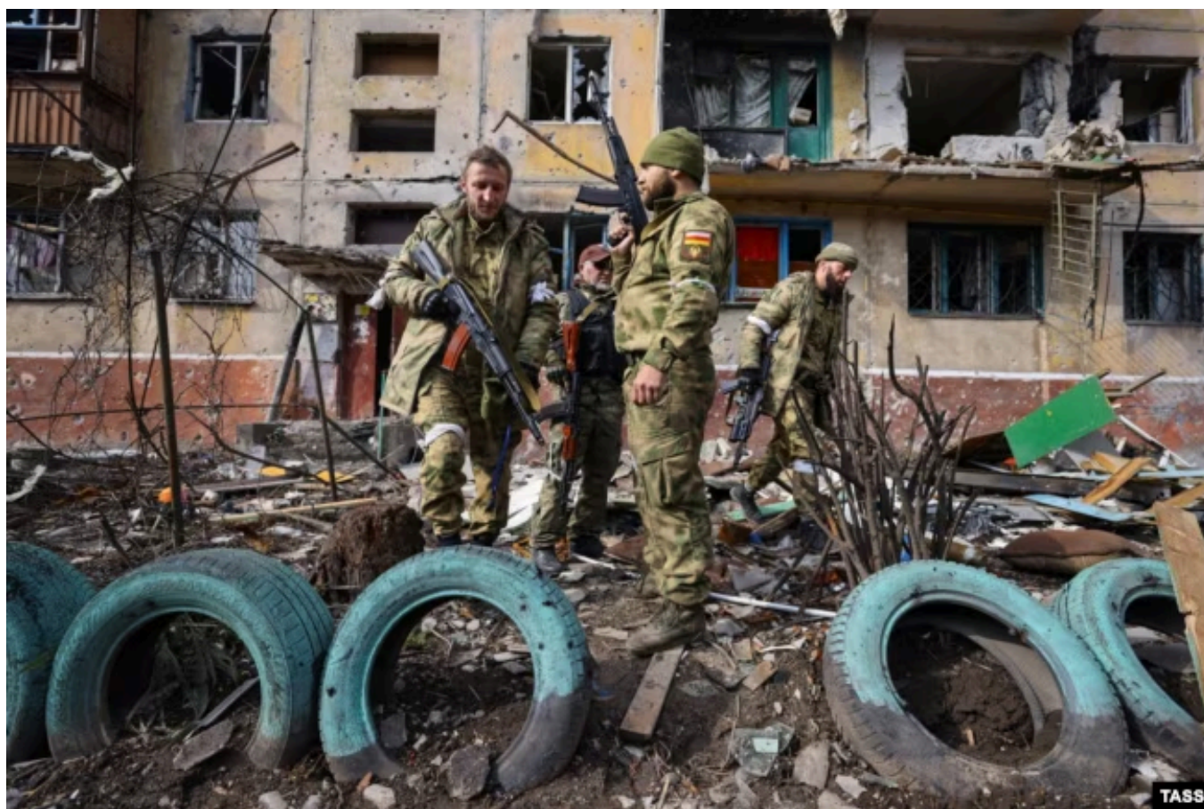
Мариуполь, апрель 2022 года