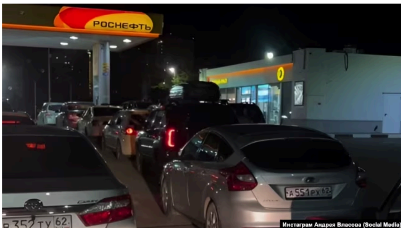
очередь на азс, Рязань