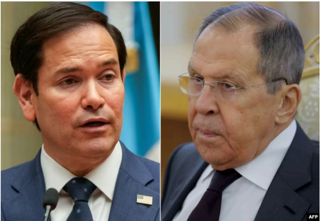
Марко Рубио и Сергей Лавров

Кремль, однако, пришел со своей версией событий. 26 июня министр иностранных дел России Сергей Лавров ответил Марко Рубио, представив подробную – и кардинально иную – реконструкцию саммита. По словам Лаврова, Путин тщательно изучил ряд американских предложений, которые посланник Трампа Стив Уиткофф привез в Москву за несколько дней до саммита. Лавров утверждал, что на Аляске Путин пункт за пунктом сверял их с Уиткоффом в присутствии Трампа и Рубио, и что Уиткофф их подтвердил.