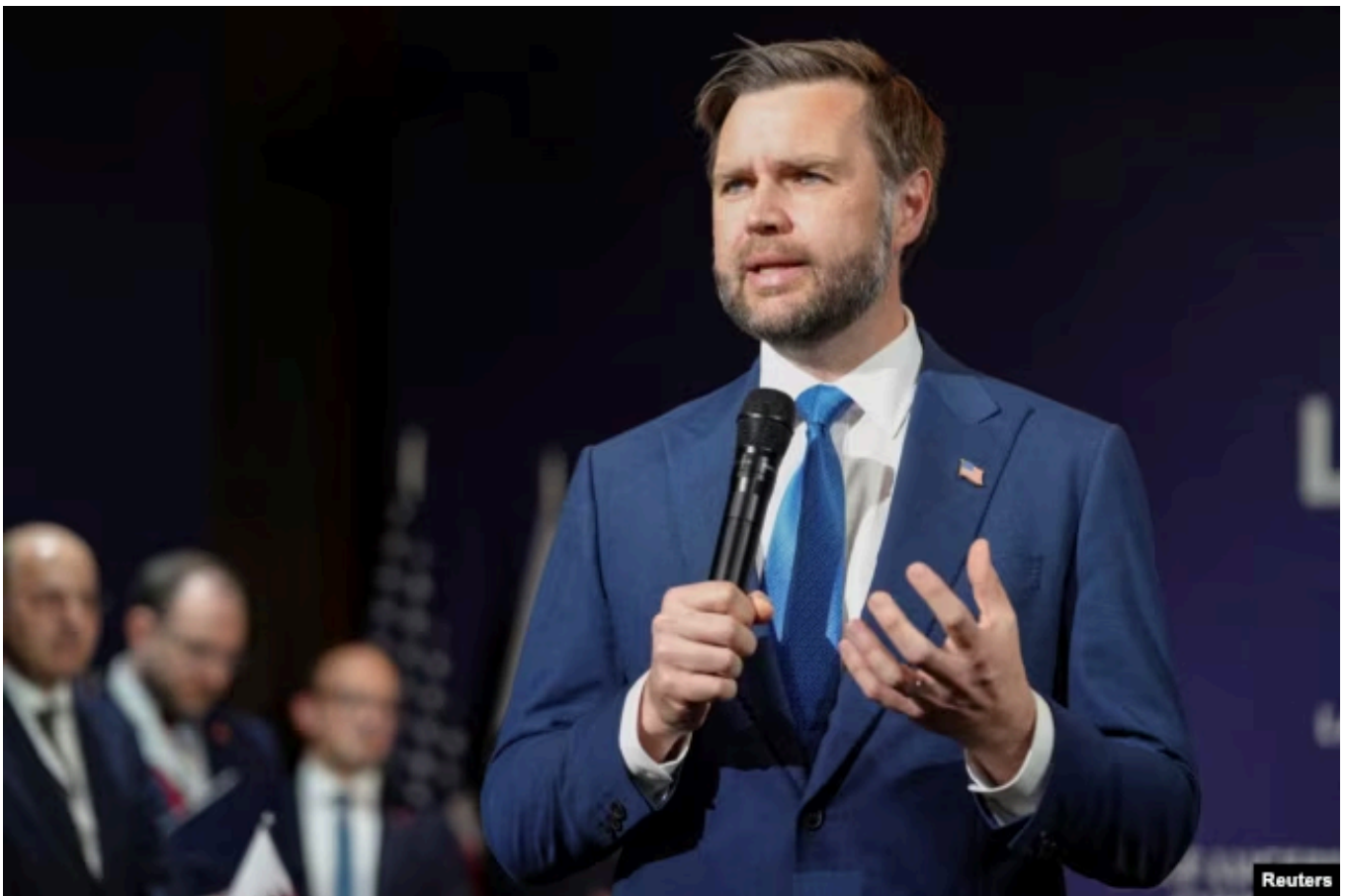
Вице-президент США Джей Ди Вэнс

Мне кажется, с Венсом это важная часть динамики. Потому что все, что мы знаем про президента Трампа, – что он очень любит драму. И, судя по всему, ему нравится, что есть напряжение, внимание вокруг поединка между Рубио и Венсом, при том, что они отрицают, что есть какое-то соперничество. Но я только что прочёл книгу "Изменение режима" Мэгги Хаберман и Джонатана Суана, корреспондентов New York Times, про первые полтора года президента Трампа, и судя по ней Трампу нравилось, что есть драма, что люди смотрят, кто же будет после него, Вэнс или Марко. И мне кажется, то, что Вэнсу дали переговоры с Ираном, – явно не выигрышное дело, – это все та же часть стратегии президента Трампа: чтобы было больше драмы, чтобы это было как его шоу The Apprentice, когда можно кого-то увольнять. Мне кажется, что президент Трамп Вэнса выталкивает на арену, чтобы посмотреть, как он справляется со сложностями.