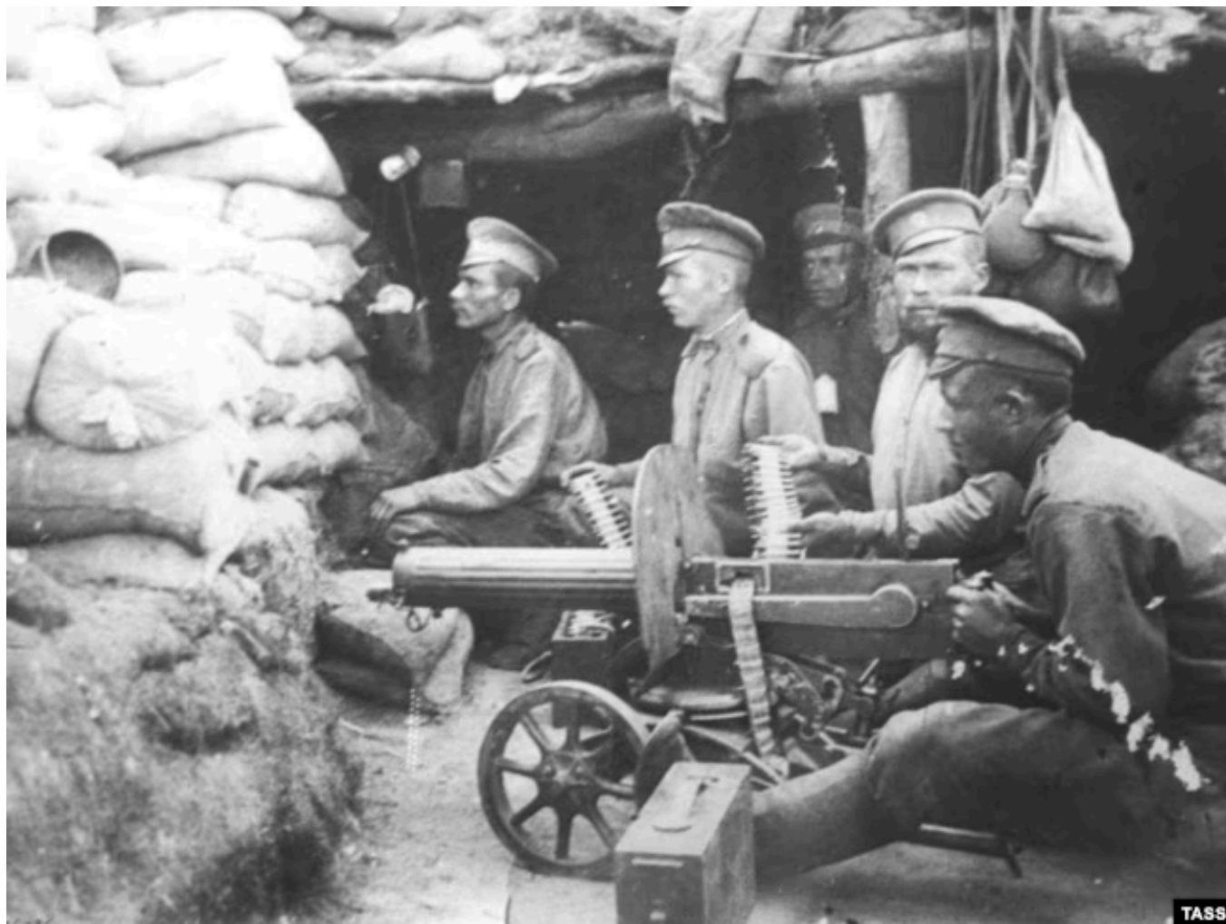
Пулеметчики русской армии на боевой позиции, 1914 год

Сербское правительство высказало согласие принять меры по всем пунктам, кроме участия в расследовании в Сербии австрийских должностных лиц, "поскольку это противоречит Конституции" и уголовно-процессуальному законодательству, но результаты расследования, отмечало сербское руководство, могут быть переданы австро-венгерской стороне.