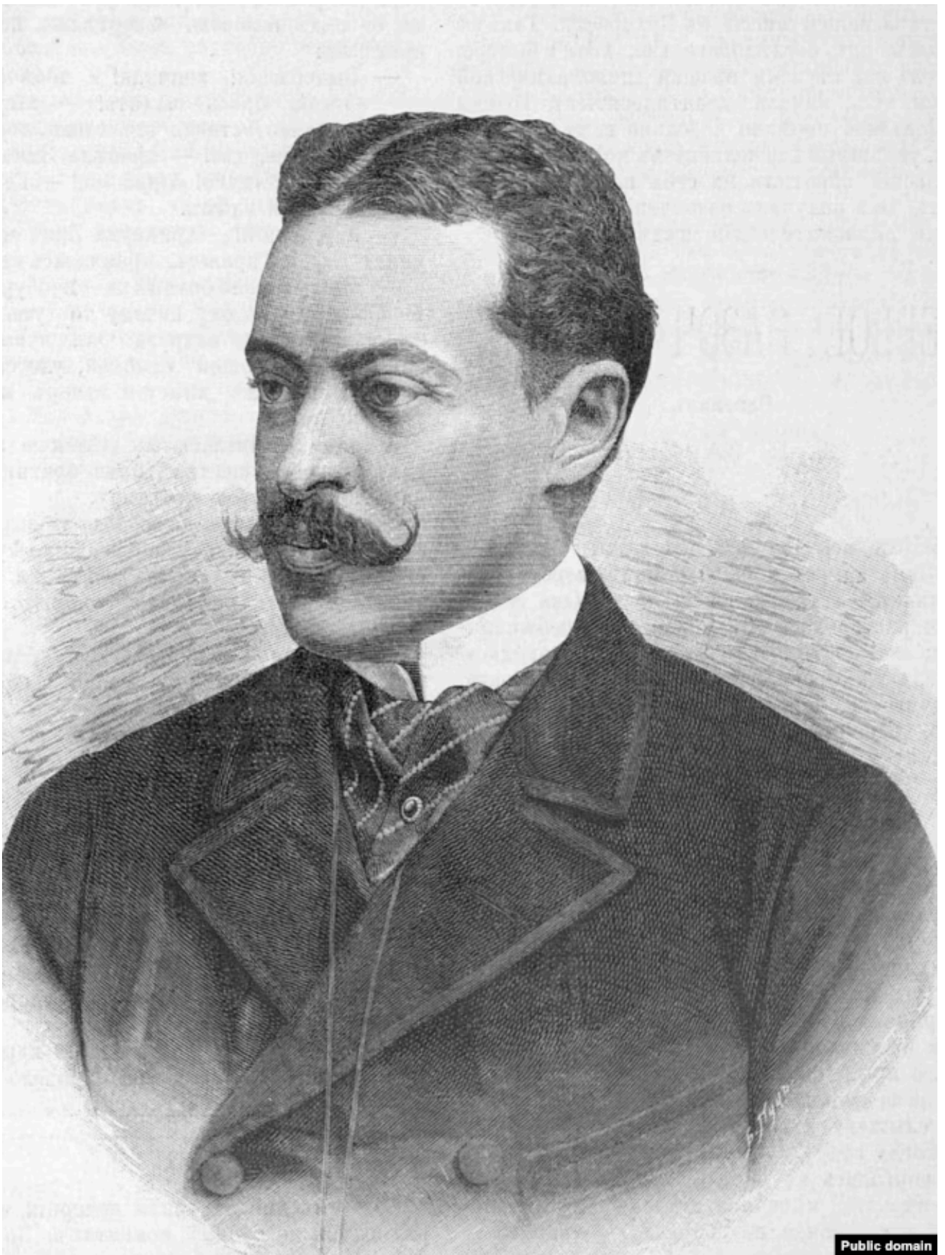
Александр Извольский, не слишком удачливый дипломат

В 1908 году Россия через главу МИДа Александра Извольского дала согласие на аннексию Австро-Венгрией Боснии и Герцеговины, которой Вена управляла с 1879 года. В обмен Австро-Венгрия должна была поддержать Россию, требовавшую свободного прохода своих военных кораблей через Босфор и Дарданеллы. Австро-