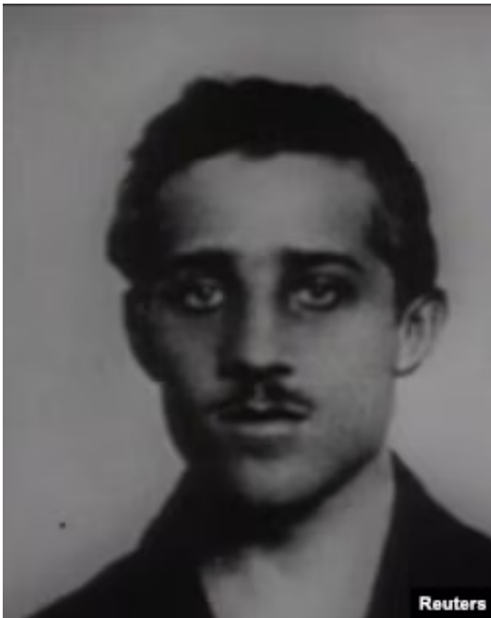
Гаврило Принцип, чьи выстрелы в Сараево иногда называют первыми выстрелами Великой войны