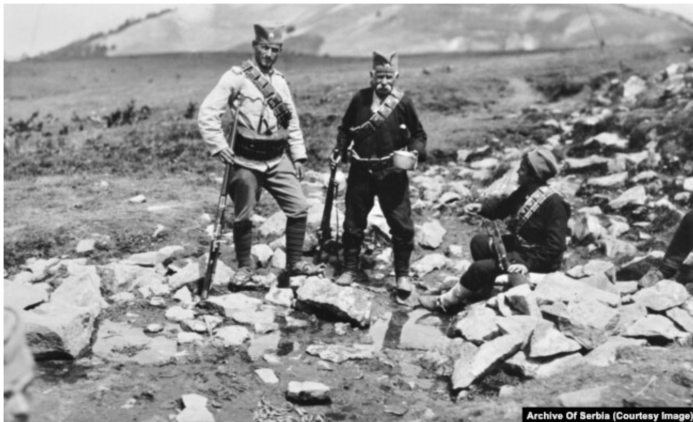
Сербские солдаты во время Первой балканской войны

Болгары затем начали осаду укреплений Эдирне (Адрианополя). 18 ноября они атаковали и хорошо подготовленные турками к обороне форты и редуты на Чаталджинской позиции перед Константинополем, но потеряли убитыми до 10 тысяч человек и вынуждены были перейти к позиционной войне.