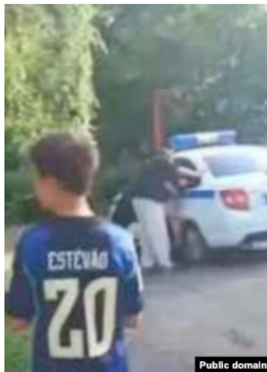
Похищения жителей в Пензенской области продолжаются

Подобная практика распространилась и на Дальний Восток. По словам местных, мужчин здесь отлавливают и избивают, принуждая к подписанию контрактов по