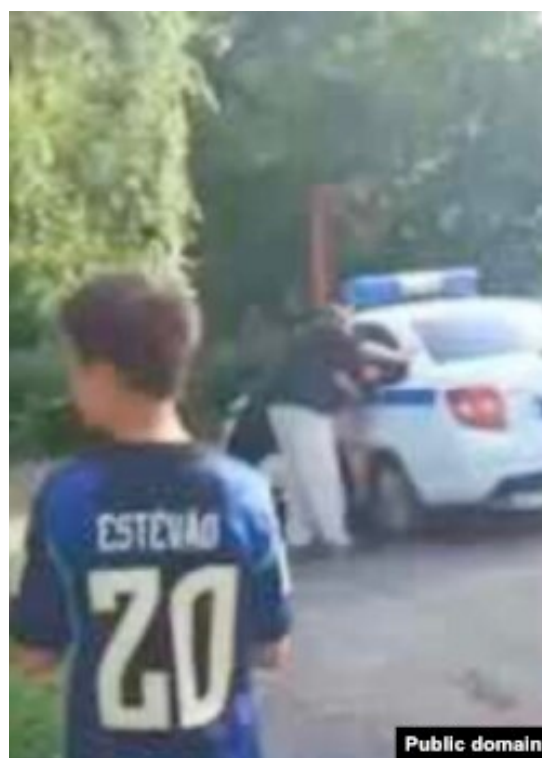
Похищения жителей в Пензенской области продолжаются

Подобная практика распространилась и на Дальний Восток. По словам местных, мужчин здесь отлавливают и избивают, принуждая к подписанию контрактов по