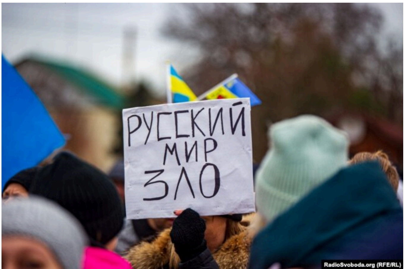
Геничеськ, Херсонская область, протест против российской агрессии, 6 марта 2022 года

Что касается ситуации в Курской области. Российские пропагандисты могут, конечно, настаивать на чём угодно, но туда же не допускают международные организации, международные мониторинговые структуры, независимых международных журналистов. И то, что они утверждают, совершенно голословно.