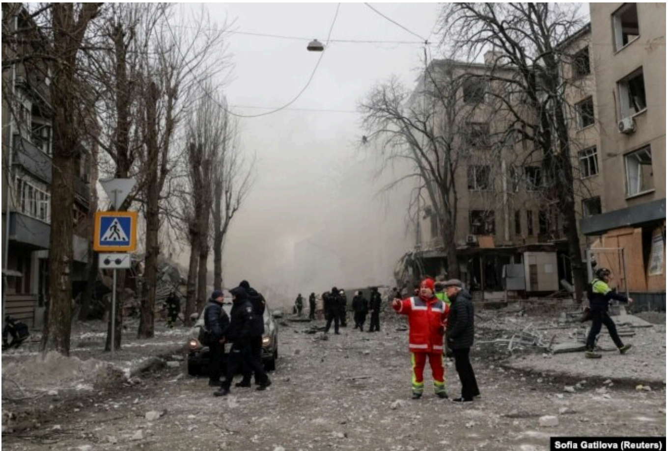
Харьков после российского авиаудара, 2 января 2022 года