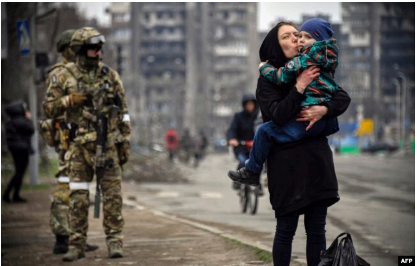
Женщина с ребенком на улице Мариуполя, 12 апреля 2022 года

– Российские власти в таком случае, как правило, говорят две вещи. Одна позиция: “вы всё врётё”. Этим комиссиям ООН верить нельзя, информацию им поставляют украинцы, украинцы хотят нас очернить. Параллельно с этим существует другая позиция: “сами такие”, они то же самое делают, все армии мира это делают, вы про них не пишете, вы про них не рассказываете. Что на это можно возразить?