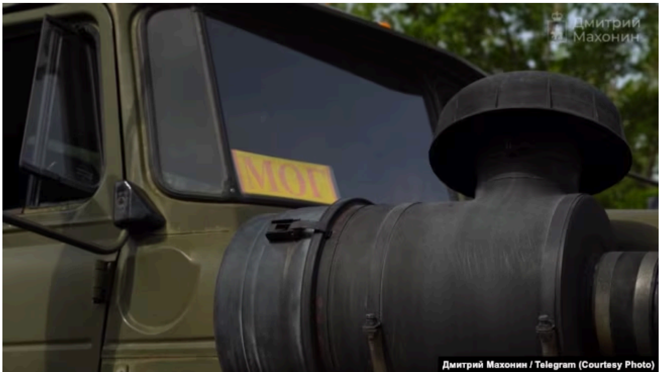
Мобильные огневые группы БАРС, Нижний Новгород

И сейчас, как мы видим по многочисленным видеокадрам попыток отражения атак, действия мобильных огневых групп на последнем рубеже обороны, как правило, ни к чему не приводят. Они крайне малоэффективны. Я не видел вообще ни одного кадра, где мобильная огневая группа сумела бы сбить дрон, который уже заходит на цель. У них есть и системы автозахвата, то есть всё в этом плане очень чётко и отработано.