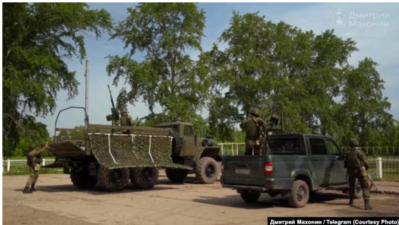
Мобильные огневые группы БАРС, Нижний Новгород

Сильно прикрыты в основном города — сам Белгород, допустим, Курск. Но между ними куча лагун. На всю огромную территорию России, конечно, не хватает ПВО — и не может хватать. Да ни у одной страны мира столько ПВО против такого количества воздушных объектов, поверьте мне, нет. Их нет ни у США, ни у НАТО, ни у кого.