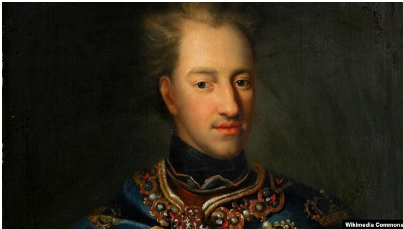
Карл XII, король Швеции

Войску Запорожскому и толпе местных жителей. Их конвоировали три царские роты. Прочитаны были их вины. Согласно оглашенной всенародно царской грамоте Кочубей и Искра за ложный донос на гетмана были осуждены на смертную казнь. Затем обоим отрубили головы на плахе. Царский указ не предполагал помилования "клеветникам", но Мазепа и не попытался проявить милосердие, просил лишь не конфисковывать имущества у семьи Кочубея.