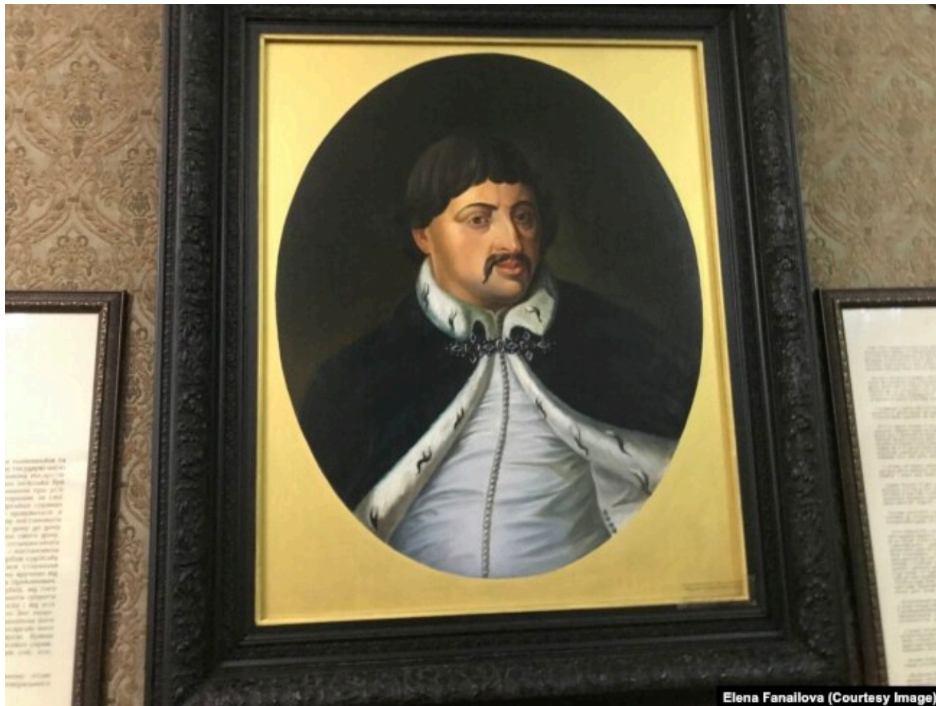
Портрет Василия Кочубея

Мазепа имел основания опасаться за судьбу петровских военных планов еще и потому, что был свидетелем дестабилизации юга России. Сначала вспыхнуло восстание в Астрахани, затем взбунтовалась часть казаков на Дону. Мятеж возглавил донской атаман Кондратий Булавин . Уже летом 1707 года гетман Мазепа из-под Киева, по царскому указу, должен был послать отряд на Дон для подавления бунтов. Царь отправил туда же войска князя Юрия Долгорукого для отыскания в окраинных городах беглых и для возвращения их на прежние места жительства. В октябре 1707 года Булавин разбил и истребил дотла весь посланный царем отряд, убил самого князя Долгорукого и потом призывал Дон и всю страну к восстанию против царской власти. Волнения могли захватить и Гетманщину. Петр I обратился к ее населению с призывом в связи с войной терпеливо сносить неудобства, обещал народу явить царскую милость по окончании войны и приказал войску "не чинить обид и разорений малороссийским жителям" под страхом жестокого наказания.