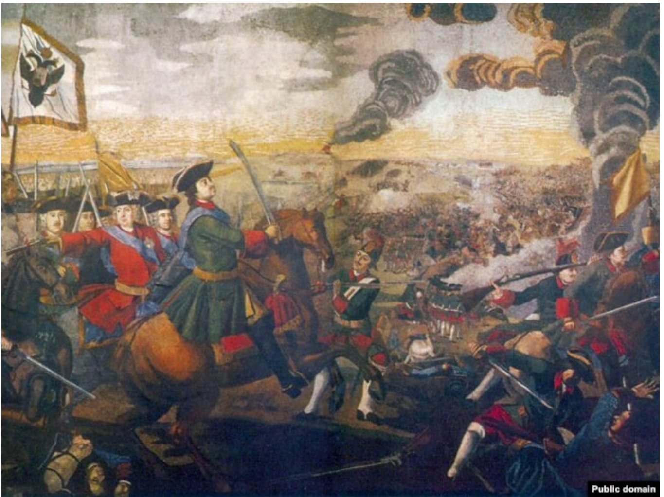
"Полтавская баталия". Мозаика мастерской М.В. Ломоносова, 1761-1765

12 ноября в Троицкой церкви, где происходила присяга гетмана, в присутствии царя, вельмож и малороссийских чинов после молебна духовными властями провозглашена была анафема и вечное проклятие "вору и изменнику Мазепе". Царский манифест от 10 ноября 1708 года призывал тех, кто "изменою вора Мазепы заведены были в неприятельские руки", "отлучиться от него и вернуться к верной службе своему государю". Объявлялась полная амнистия всем тем, кто покинет Мазепу за месяц после 10 ноября. Не подчинившимся казакам грозила смертная казнь, а их родным – ссылка и конфискация имущества. Не поддержавшая Мазепу старшина была награждена поместьями за верность. Особенно щедро бы пожалован черниговский полковник Павел Полуботок , а открывший путь к взятию Батурина Иван Нос стал прилуцким полковником.