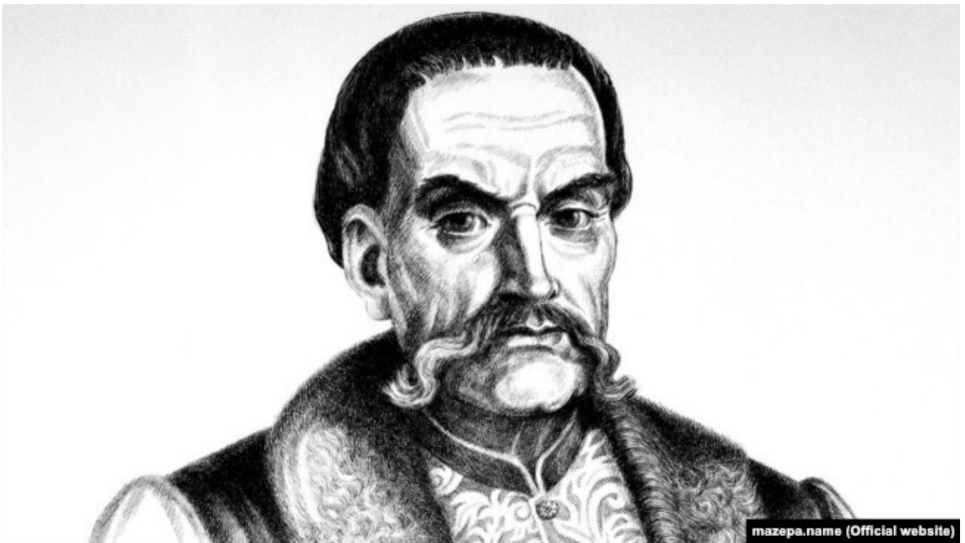
Портрет Ивана Мазепы, 1991 год. Художник Василий Лопата

После окончания войны с турками казачьи услуги полякам показались не нужны. Август II и сейм приняли в 1699 году решение распустить казацкое войско, вся его служба прекращалась, и казаки потеряли право занимать земли в чужих владениях. Но новое казачество постановлению не подчинилось. Коронный гетман Яблоновский предпринял было поход на Хвастов, но Палий от него откупился. В 1702 году был организован поход на Богуслав, но казаки Самуся выгнали представителей польской власти и побили "панов и евреев". Все эти полковники стали просить у гетмана Мазепы принять их с землями в российское подданство. Бунт, похожий на новую Хмельничину, распространялся быстро. Казаки Самуся разгромили польское ополчение в Бердичеве, Самуся и Палий осадили и взяли Белую Церковь, а потом и Немиров, где отметились погромами и казнями со сдиранием кожи. Появилось много мелких разбойничьих шаек. Началось массовое бегство мирных людей в Польшу. Регулярное войско было занято войной против шведов, и только в декабре 1702 года польский гетман Сенявский объявил поход для подавления казацкого мятежа.