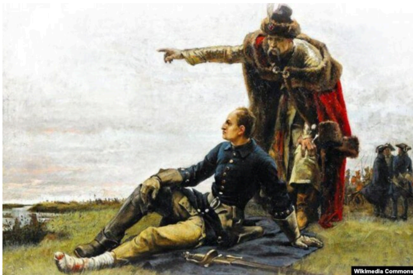
Картина Густава Седерстрёма "Мазепа и Карл XII после Полтавской битвы"

Короля долго уговаривали покинуть войско. Карл XII решил отступить в Бендеры, находившиеся в пяти днях пути, как предлагал Мазепа, а не в Крым. Пока шли дискуссии шведских генералов, что делать дальше, Мазепа переправился первым со своими ближайшими сторонниками. На имевшихся судах и построенных плотках с королем и частью избранных им генералов удалось перевезти к полуночи полторы тысячи человек. Оставшееся потерявшее дисциплину шведское войско утром составляло 13–14 тысяч, из них до 5 тысяч раненых. Переговоры с Меншиковым привели к сдаче сил генерала Левенгаупта на капитуляцию. Оставшиеся запорожцы, предполагая свою печальную участь, пытались переплыть Днепр. Почти две тысячи призванных в войско Мазепы служить крестьян победители пощадили, вернув в прежнее состояние, две сотни взятых в плен запорожцев ждали казнь или ссылку в Сибирь.