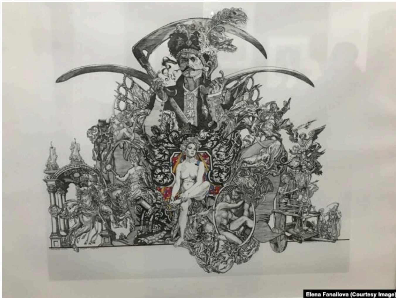
Рисунок Сергея Якутовича из серии к фильму режиссера Юрия Ильенко "Молитва за гетмана Мазепу" (2001)

На 25 июля 1687 года было назначено избрание нового гетмана, на поле рядом с казацким станом поставили шатер. Примерно в 10 часов утра главнокомандующий князь Василий Голицын с боярами вышел к толпе в две тысячи казаков в сопровождении ратных сил Рязанского и Новгородского разрядов. Знаки гетманского достоинства – бунчук , булаву и царское знамя – освятили в походной церкви. Эти клейноты положены были на столе перед шатром, поставили там образ Всемилостивого Спаса, положили крест и Евангелие.