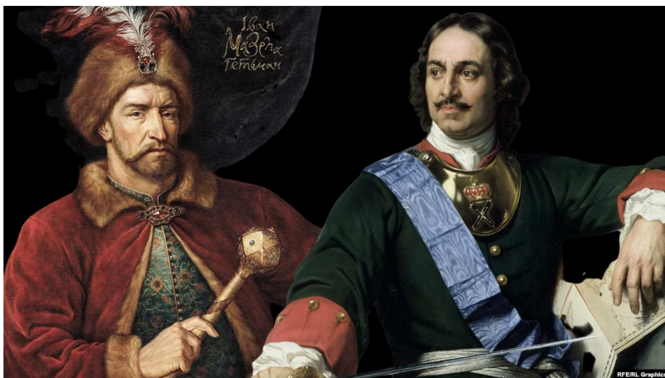
Иван Мазепа и Петр I, коллаж

Радио Свобода повторяет публикацию из цикла "Развилки" – серии статей о переломных моментах истории, когда она могла пойти совсем другим путем. Какими были исторические альтернативы и почему они остались нереализованными?