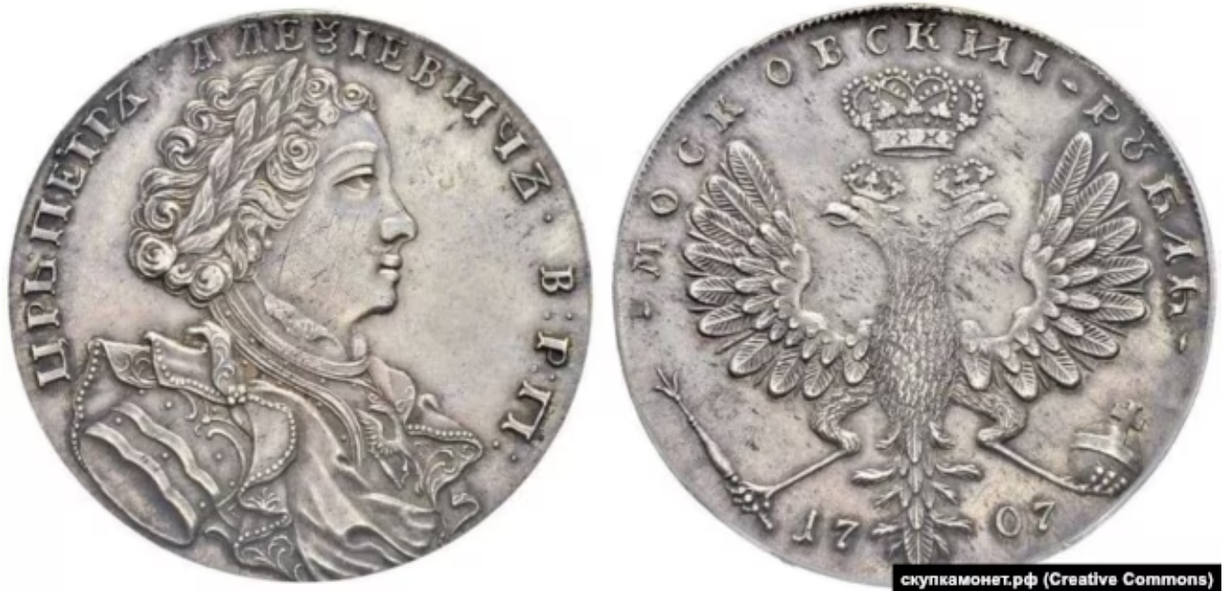
Царский символ: портрет Петра I на серебряном рубле 1707 года выпуска

Гетман, которому покровительствовал Голицын, будучи вызван к Троице, боялся опалы. Но Мазепа был встречен 10 сентября торжественно в шатре у монастыря, где вручил царю и его матери драгоценные дары. От имени молодого царя объявили гетману и всем старшинам похвалу за военные походы. Немилость Петра к Голицыну не падала на иных участников крымской экспедиции. Мазепа бил челом, чтобы великий государь "держал его всегда в своей милости со старшинами и со всем народом малороссийским".