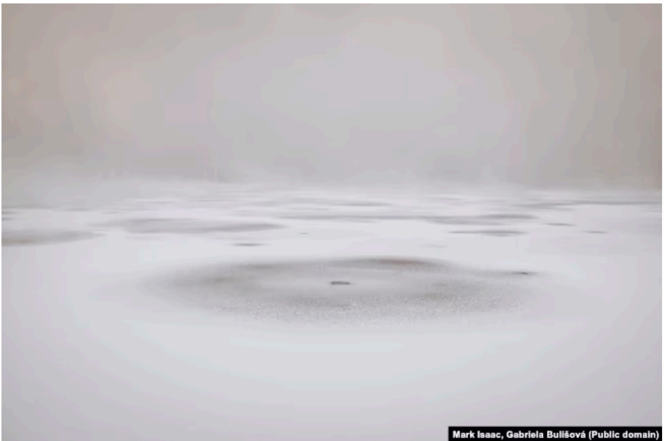
Фрагменты тонкого льда на поверхности Байкала зимой

милым животным в мире. Выживание нерпы зависит от толщины ледяного покрова, а сейчас лед сохраняется на поверхности озера менее продолжительное время и стал тоньше, чем раньше. Мы можем наблюдать это визуально – на некоторых наших фотографиях, в том числе на снимке, помещенном на обложку книги, которая опубликована параллельно с выставкой. На снимке видны участки слабого льда посреди зимы, от них поднимается пар. И это действительно признак того, что, даже если большая часть озера замерзла, на улице очень холодно, вода нагревается и проявляет признаки стресса, что крайне важно для здоровья озера. Это один пример.