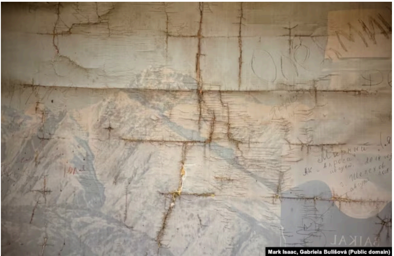
Старая карта с озером Байкал

– Вы работали в академической среде. Что говорят российские ученые об этой ситуации? Могут ли они влиять на ситуацию и остановить политические решения о вырубке леса и строительстве на берегу Байкала?