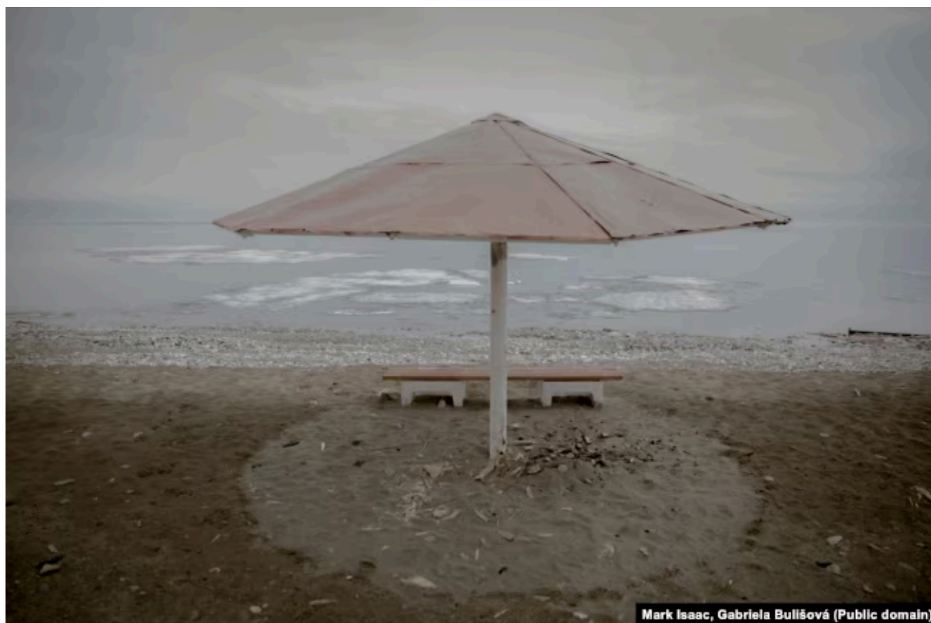
Пляж Байкала весной

сказал он. Мне кажется, что это хорошо демонстрирует отношение местных жителей, которое, думаю, коренится в убеждениях местных. Они окружены шаманскими и буддийскими традициями, ведь в этом регионе находится и один из центров российского буддизма. Люди часто практикуют и то, и другое, но у них действительно есть ощущение, и мы об этом говорили также непосредственно с шаманами, что озеро Байкал – могущественное существо, и что у них есть глубокая и прочная связь с ним. Конечно, не все так чувствуют, многие люди утратили эту связь и теперь видят экономическую выгоду в использовании озера как ресурса. Мы, безусловно, это тоже наблюдали, но многие люди по-прежнему чувствуют связь с Байкалом. При этом и это проблематично, так как один из местных религиозных лидеров, а мы общались с несколькими из них, сказал, что его молитва сильна и он верит, будто Байкал сможет восстановиться сам, без помощи людей. В нынешней ситуации это ошибка. Нам кажется, что это снимает с людей ответственность, а мы считаем, что люди должны действовать. При этом связь с природой местных людей очень важна и нуждается в сохранении.