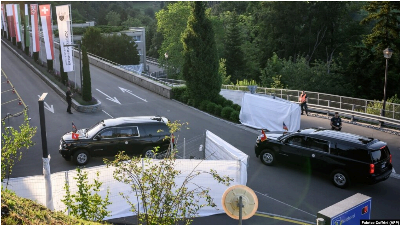
Кортеж Вэнса в Швейцарии

Вице-президент США Джей Ди Вэнс 21 июня прибыл в Швейцарию, где, как ожидается, он примет участие в переговорах с иранской делегацией при участии посредников из Пакистана и Катара.