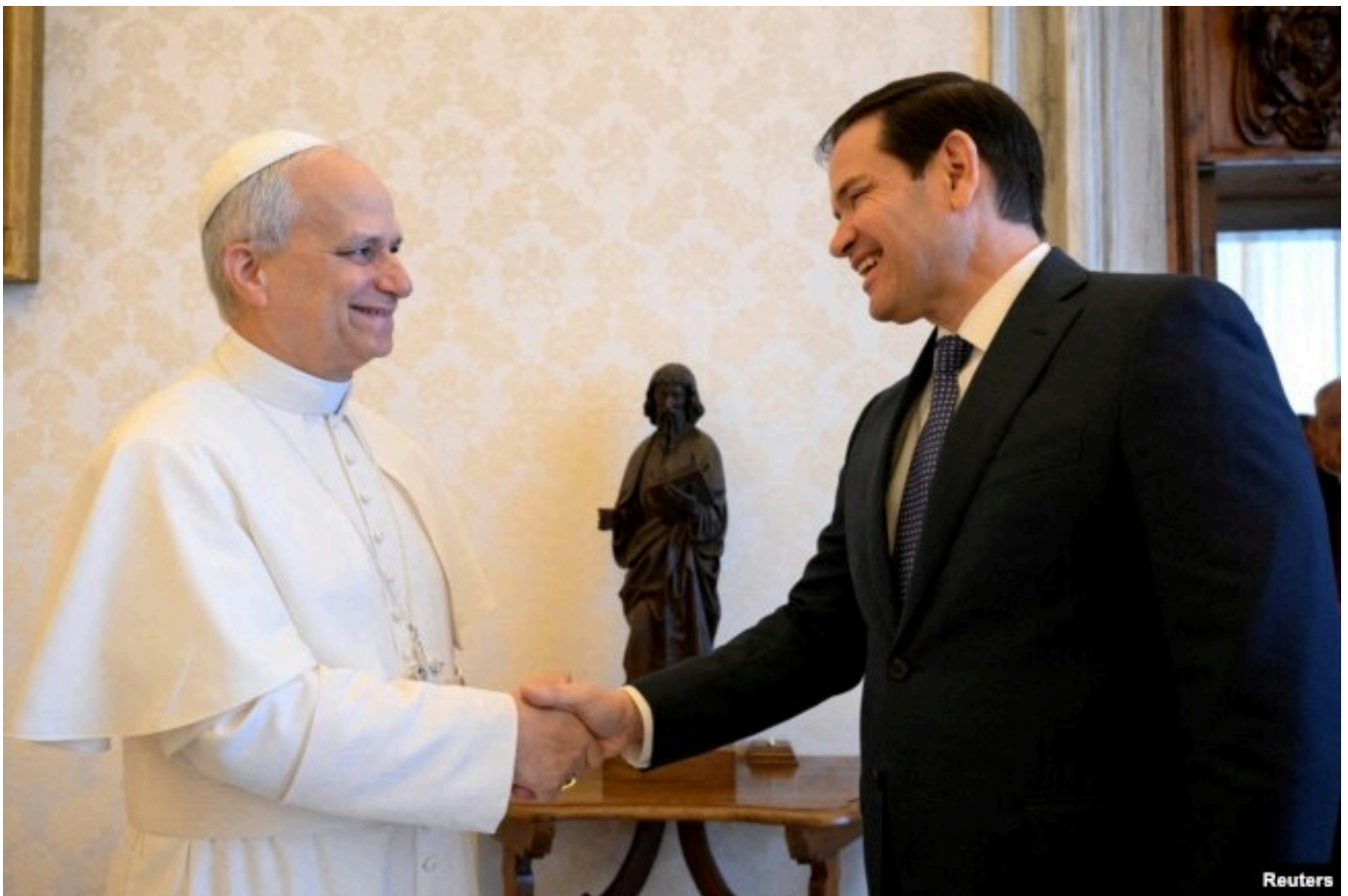
Папа Лев XIV принимает госсекретаря США Марко Рубио. Ватикан, 19 мая 2025 года