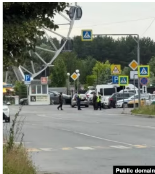
Фото, которые пензенцы публикуют в сети с предупреждением об облавах

Он отмечает, что объектами такого давления чаще становятся люди, которых власти считают уязвимыми.