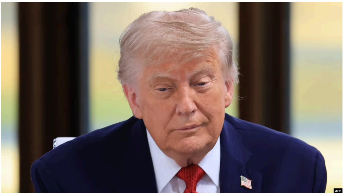
Президент США Дональд Трамп

Мирные переговоры между США и Ираном, которые должны были пройти 19 июня на горнолыжном курорте Бургеншток в Швейцарии, не состоятся. Об этом сообщил МИД Швейцарии, передает CNN.