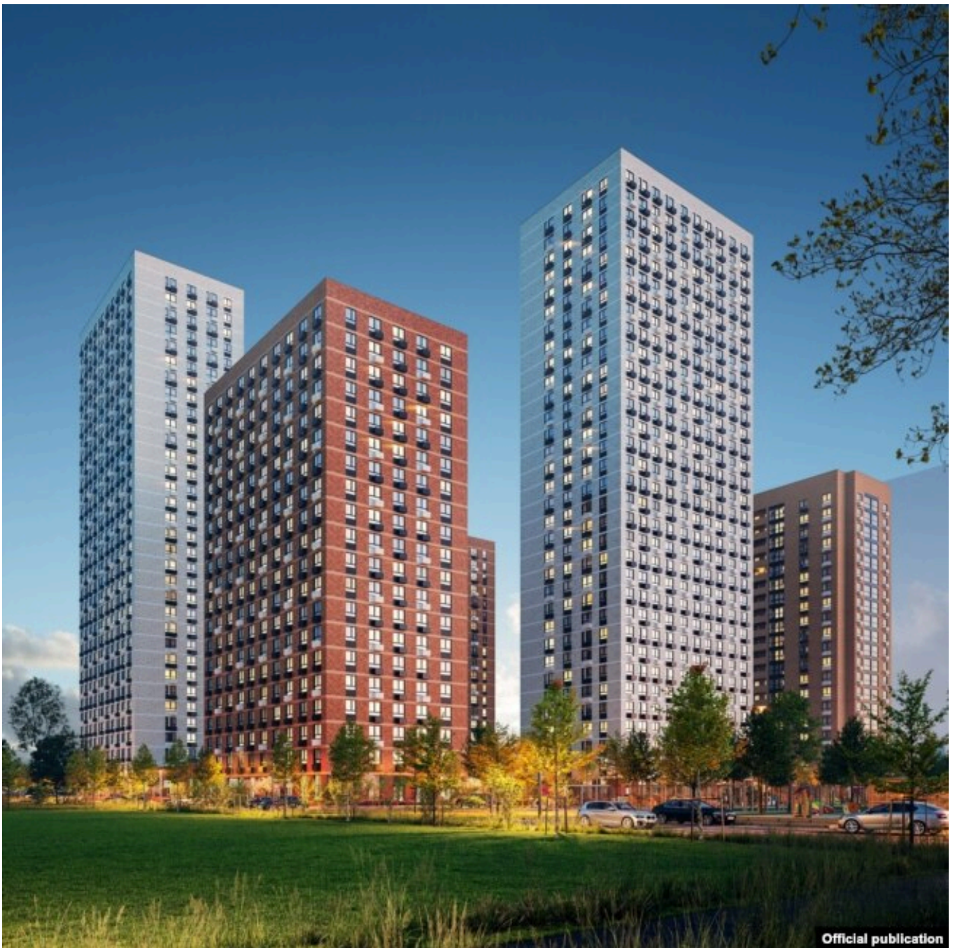
ЖК "Мичуринский парк"

– Известны ли вам случаи, когда людям удавалось уже во время судебных заседаний убедить суд прекратить дело, оставить квартиру за ними и пускай обманутый человек дожидается другого процесса в рамках уголовного и требует деньги с тех мошенников, которые его обманули?