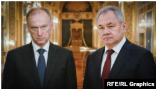
Николай Патрушев и Сергей Шойгу

этапу за все те прегрешения, которые он совершал, будучи министром обороны. Это не столько коррупция, которая естественна для путинской системы, столько то, что он обманул ожидания главнокомандующего и ввёл его в заблуждение по поводу готовности армии побеждать и, напротив, неготовности украинской стороны защищаться. Дескать, во всём виноват Шойгу. Но пока, судя по всему, этого не получается. Это будет означать признание того, что Путин ошибался, когда назначал Шойгу министром обороны и секретарем Совета безопасности. Получается, это признание того, что Путин ошибается в людях. Я думаю, что только за счёт этого Шойгу и держится.