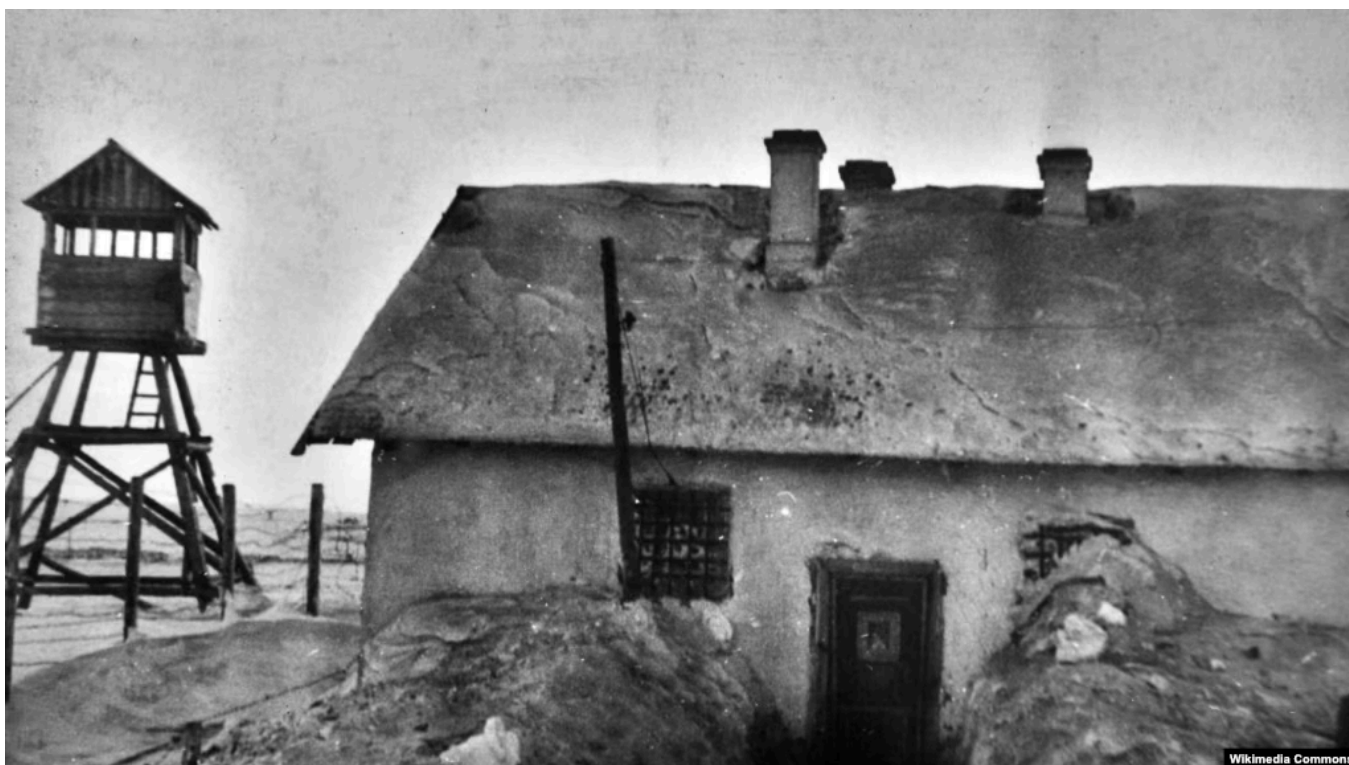
Штрафной изолятор Воркутлага

Власти города Воркута демонтировали памятный знак жертвам ГУЛАГа с именами заключённых, погибших в Воркутинских лагерях в советские времена. Об этом сообщило в среду государственное агентство ТАСС, отметив, что памятник снесли по просьбе участника войны в Украине.