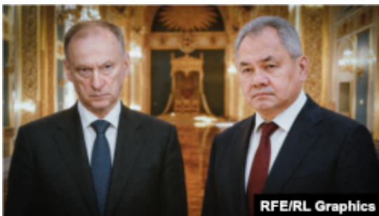
Николай Патрушев и Сергей Шойгу

этапу за все те прегрешения, которые он совершал, будучи министром обороны. Это не столько коррупция, которая естественна для путинской системы, столько то, что он обманул ожидания главнокомандующего и ввёл его в заблуждение по поводу готовности армии побеждать и, напротив, неготовности украинской стороны защищаться. Дескать, во всём виноват Шойгу. Но пока, судя по всему, этого не получается. Это будет означать признание того, что Путин ошибался, когда назначал Шойгу министром обороны и секретарем Совета безопасности. Получается, это признание того, что Путин ошибается в людях. Я думаю, что только за счёт этого Шойгу и держится.