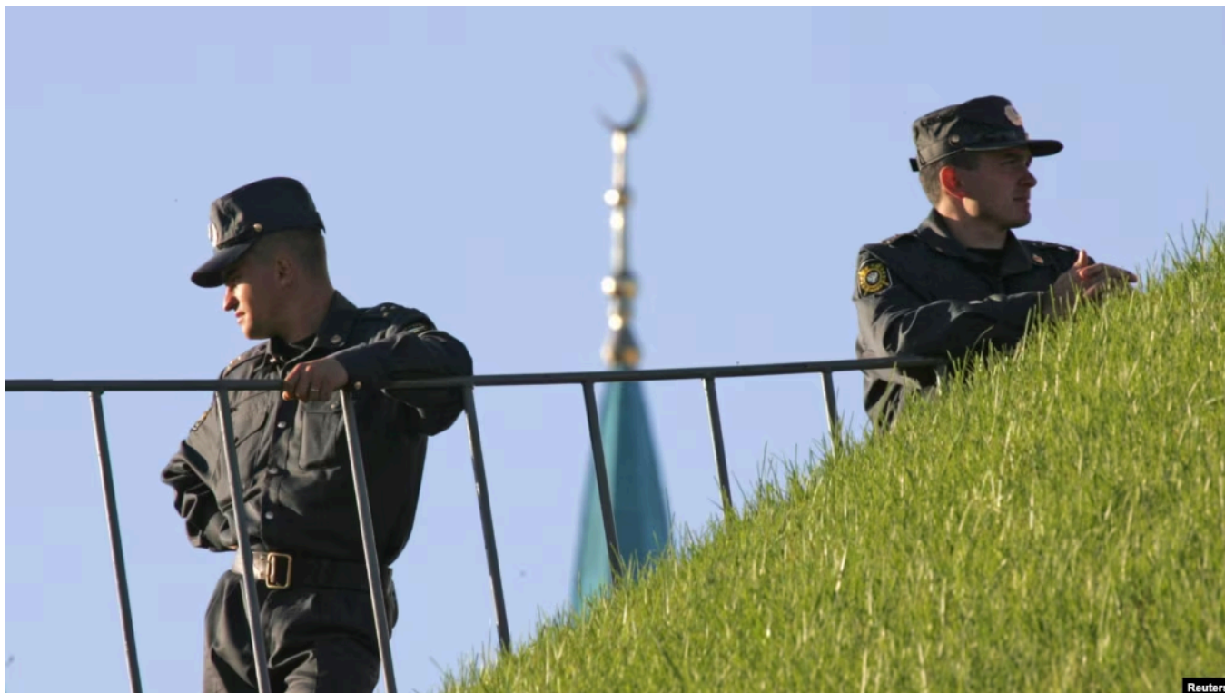
Полицейские в Казани

В преддверии поездки президента России Владимира Путина в Казань для участия в самите "Россия-АСЕАН", который открывается в среду, в столице Татарстана существенно усилили меры безопасности. Внимание на это обратило "Агентство" , которое отмечает, что поездка в Казань станет для Путина первым с 6 ноября 2025 года посещением российского региона, где нет его резиденций (с ноября прошлого года до сегодняшнего дня он посещал - во всяком случае публично - только Москву, Московскую область, Санкт-Петербург и Новгородскую область).