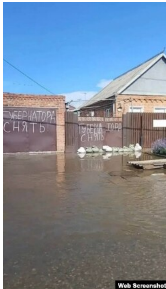
В микрорайоне 9-й километр

Маловероятно, что очередной потоп станет поводом для масштабного коммунального протеста, отмечает аналитик по Северному Кавказу Гарольд Чемберз: "В подобных случаях основное внимание уделяется тому, чтобы добиться реакции властей на бедствие. Некоторые попытки привлечь внимание государства могут восприниматься как протест, но это зависит от намерений, стоящих за такими действиями. Если провалы властей окажутся достаточно серьезными, а бедствие – масштабным, может возникнуть определенный риск более крупных протестов, однако в последние годы такие случаи были относительно редки".