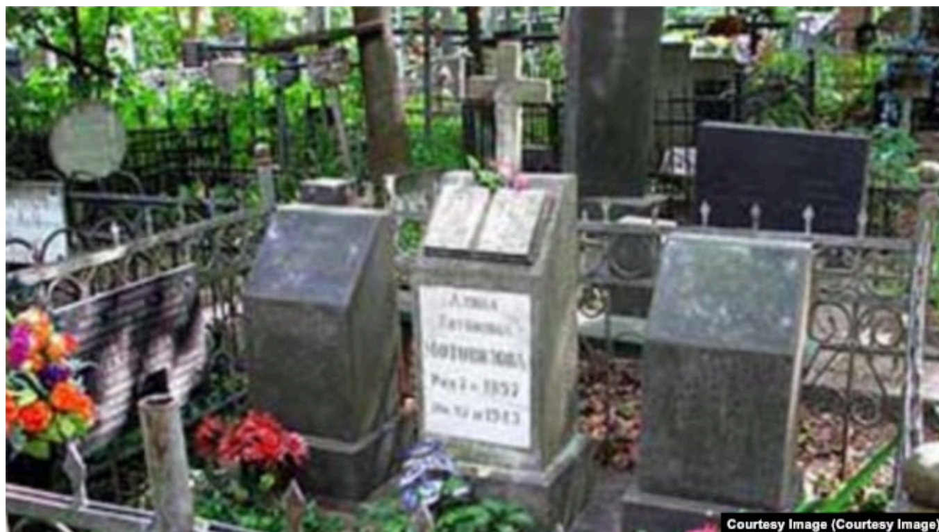
Могилы бабушки, тети и матери Виктора Некрасова в Киеве