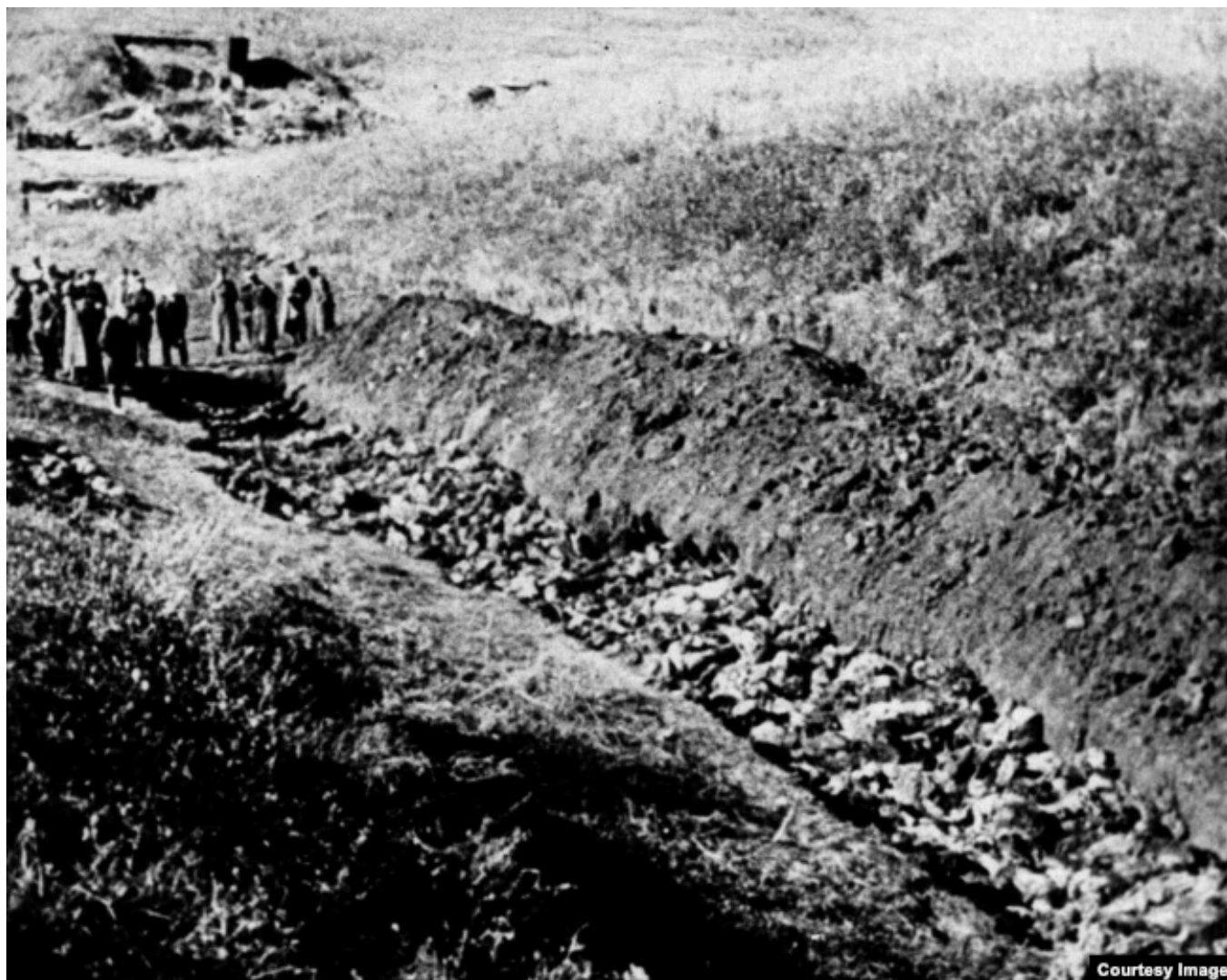
Бабий Яр. Архивное фото