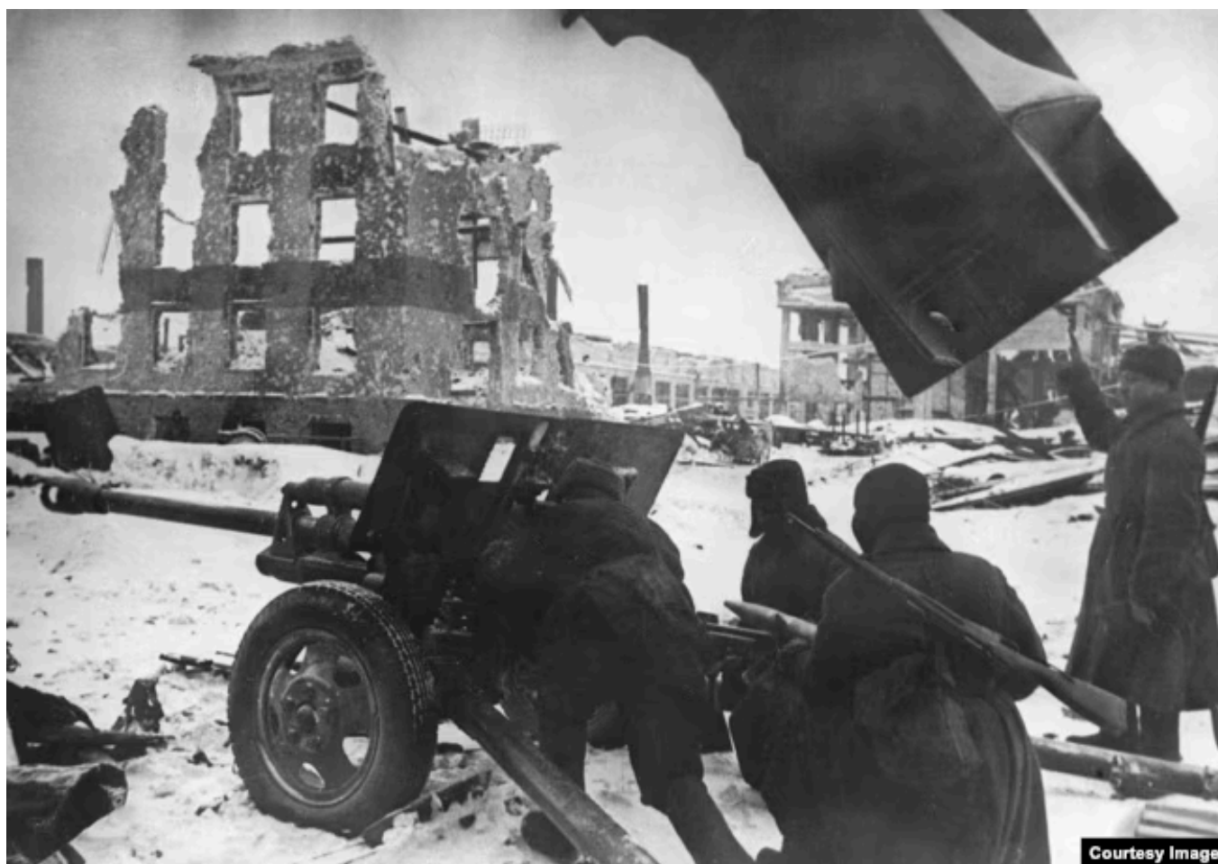
Битва за Сталинград. Архивное фото

сказать правительству: вы не оправдали наших ожиданий, уходите прочь, мы поставим другое правительство, которое заключит мир с Германией и обеспечит нам покой. Но русский народ не пошел на это, ибо он верил в правильность политики своего правительства, и пошел на жертвы, чтобы обеспечить разгром Германии. И это доверие русского народа Советскому правительству оказалось той решающей силой, которая обеспечила историческую победу над врагом человечества – над фашизмом". Из выступления на приеме в Кремле в честь командующих войсками Красной Армии 24 мая 1945 года. И. В. Сталин.