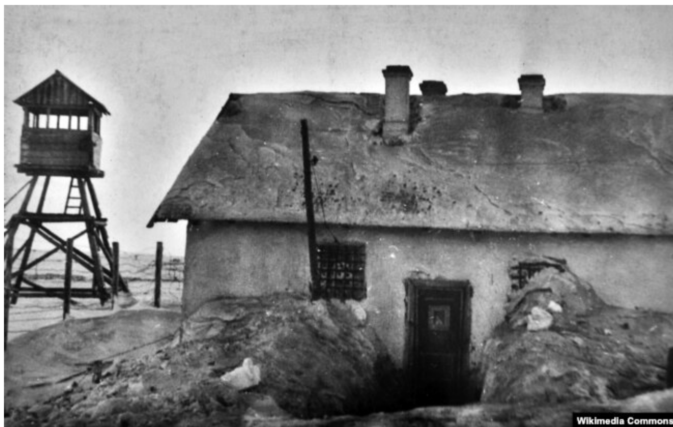
Штрафной изолятор Воркутлага