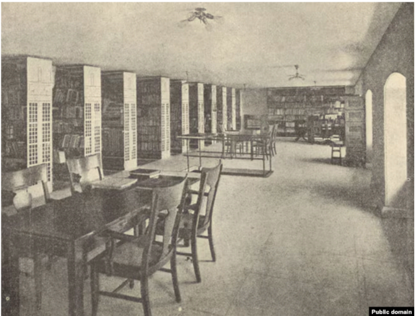
Славянская секция Библиотеки Конгресса США