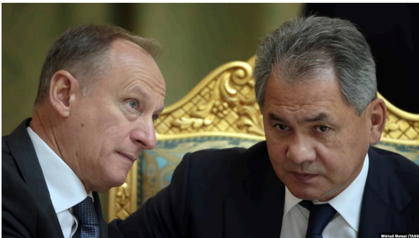
Николай Патрушев и Сергей Шойгу

Бывший директор ФСБ, помощник президента России Николай Патрушев переложил ответственность за гибель заложников во время штурма захваченного террористами театрального центра на "Дубровке" на спасательные службы. Об этом он заявил в интервью "Российской газете". На высказывание Патрушева обратило внимание "Агентство".